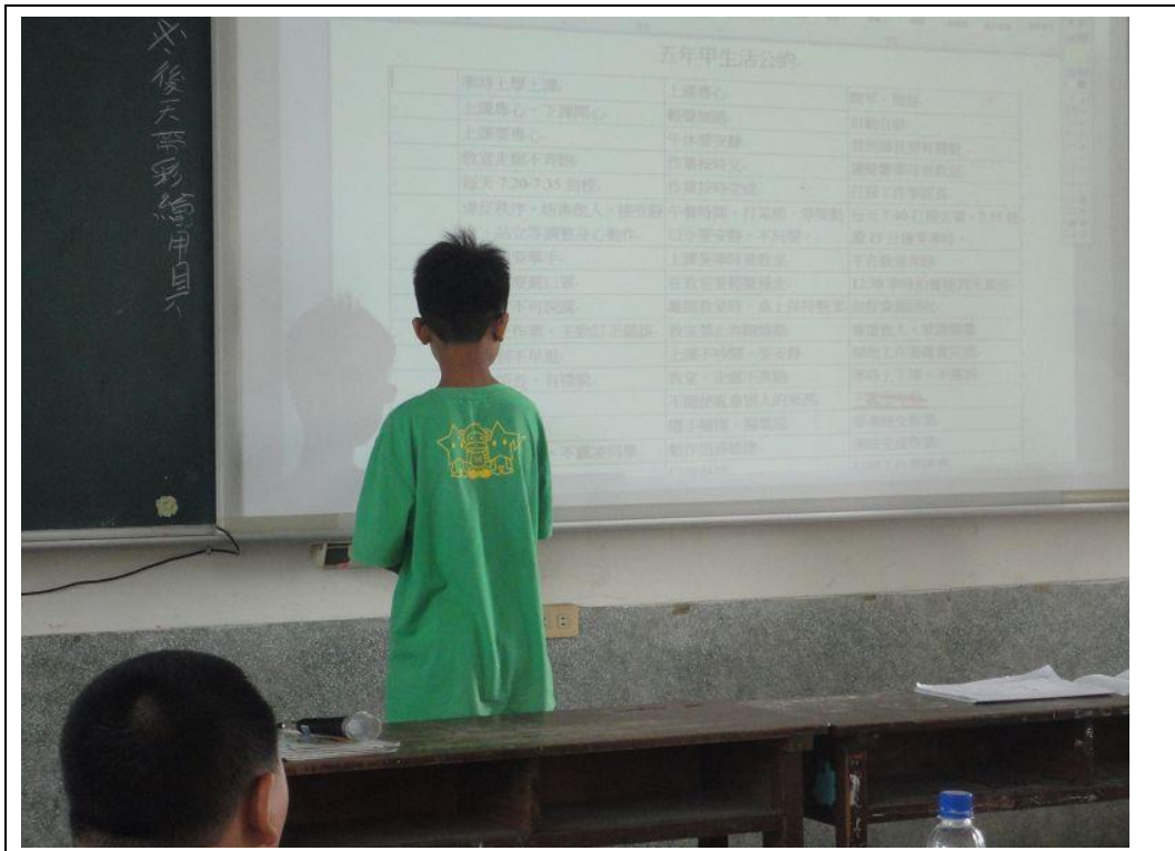
班級師生透過班會討論並建立班級公約