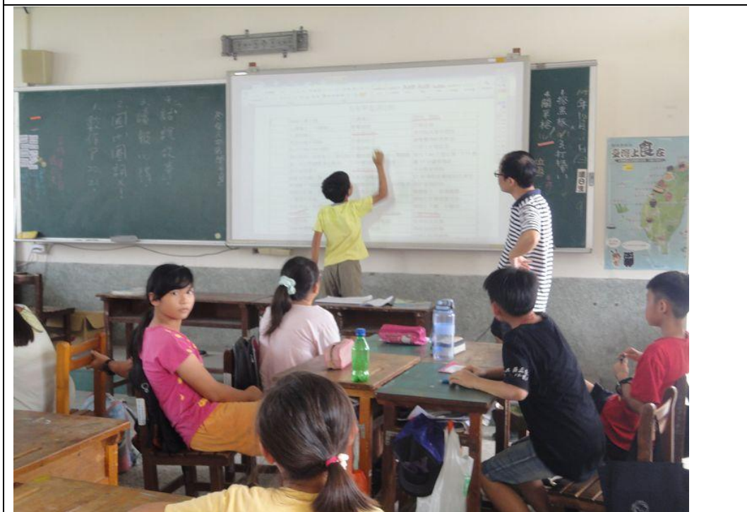
由老師講解班級公約內容，大家一起共同遵守