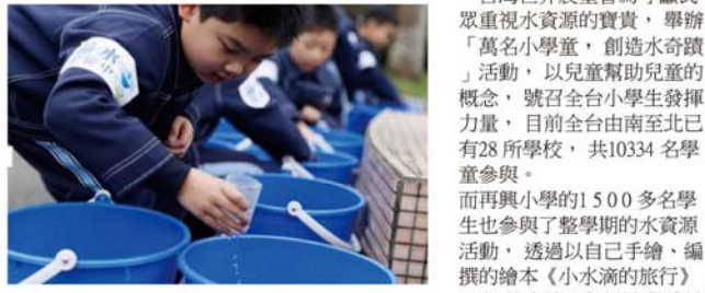
小朋友體驗節水去澆花。

【記者楊錦傑／台北報導】根據統計，世界上每11個人，就有1人缺乏乾淨水可用，每年更有84萬人死於不乾淨的水引發的腹瀉。在3月22日世界水資源日前夕，再興國小透過推廣節水知識、分享節水密招，甚至更親自力行節水，呼籲大眾重視水資源短缺問題，也為世界上缺水的兒童發聲。