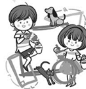
藝術與人文領域(美勞)： 平面創作