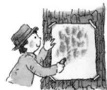
自然領域：自然拓印