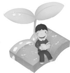
社會領域： 寫給自己三年級的一封信