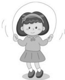
健康與體育領域(體育)： 歡樂一起跳