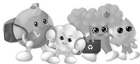
健康與體育領域(健康)： 健康最重要