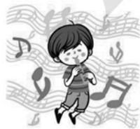
藝術與人文領域(音樂)： 藝文饗宴