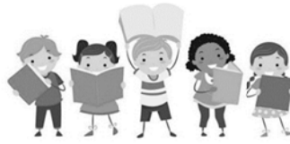
語文領域(閱讀)：生活閱讀趣