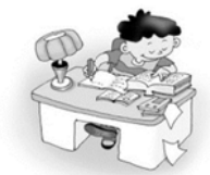
語文領域(國語)： 文字王國