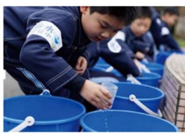
小朋友體驗拿雨水去澆花。

【記者楊錦傑/台北報導】根據統計，世界上每11個人，就有一人缺乏乾淨水可用，每年更有84萬人死於不乾淨的水引發的腹瀉。在3月22日世界水資源日前夕，再興國小透過推廣節水知識、分享節水密招，甚至更親自力行節水，呼籲大眾重視水資源短缺問題，也為世界上缺水的兒童發聲。