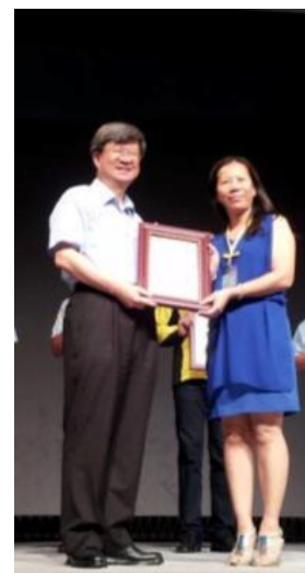
節能減碳績優學校，與吳思華部長合影