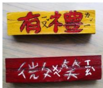
品格期待—手刻的溫度