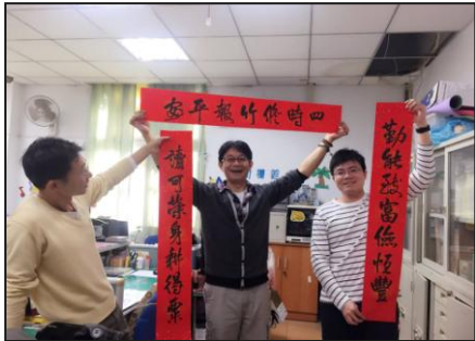
教師會會長寫春聯義賣籌措助學金，有 65 位教師、志工、家長響應，募得助學金 28,380 元。

很多時候，我們必須要對眼前的事情賦予一個正面的意義和解釋。這將有助於我們願意去行動，去執行它。～王意中臨床心理師