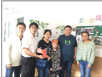
教師會協助巡迴班腦瘤開刀學生助學金 3000 元。