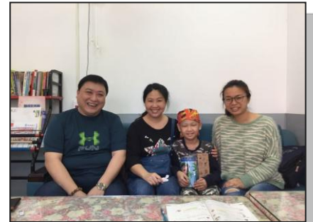
會長鼓勵巡迴班腦瘤開刀學生，贈送水壺及存錢筒。