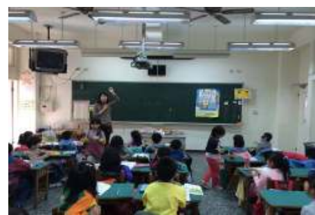
腸病毒及洗手教育衛生宣導