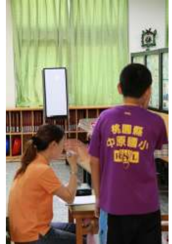
身高體重及視力測量