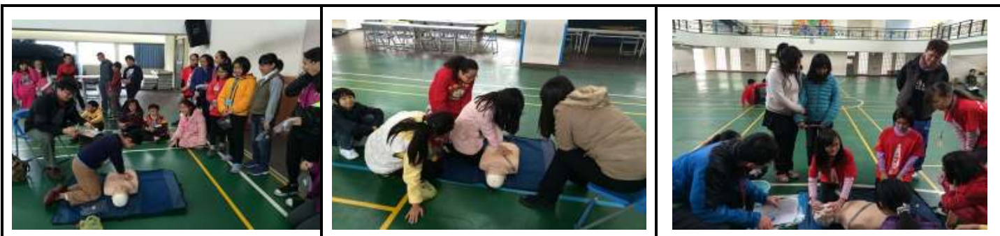
六年級學生 CPR 急救訓練實作測驗