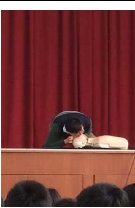
高年級學生 CPR 急救訓練學理課程