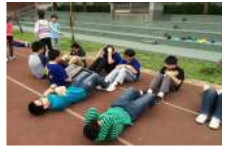
健康體位班上課情況