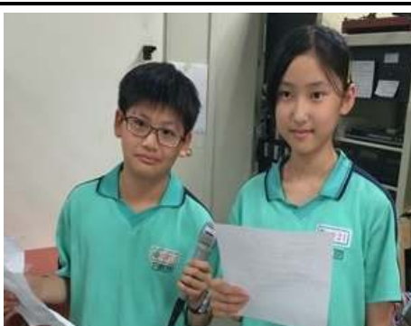
營養教育學習單和學生營養教育廣播宣導