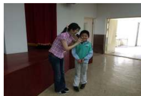
學生營養教育講座