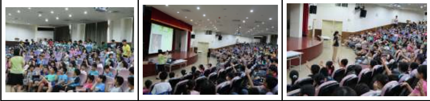
六年級學生愛滋病防治研習