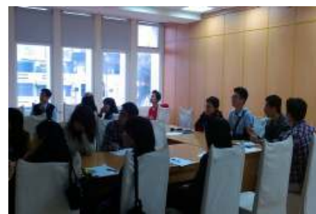
教師營養教育講座