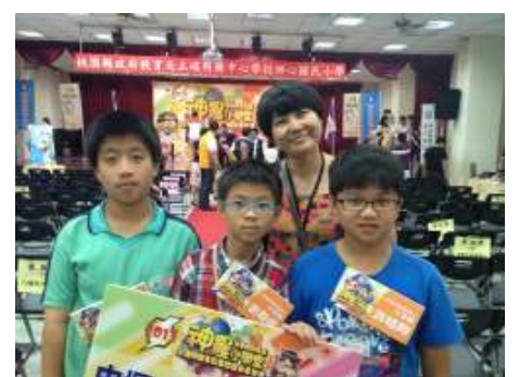
2013 神農小學堂用藥知識競賽