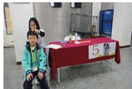
學生健康檢查情形