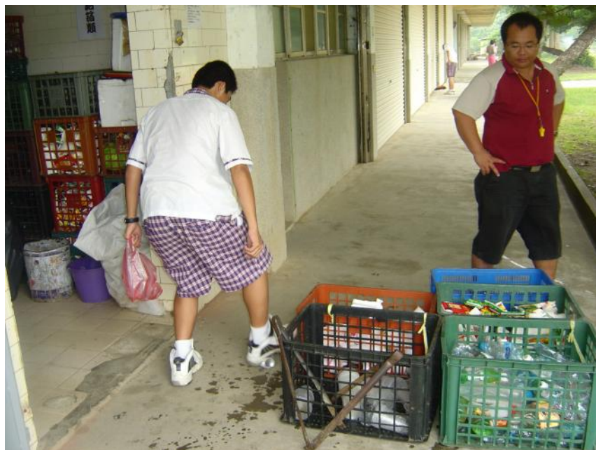
說明：資源回收情形