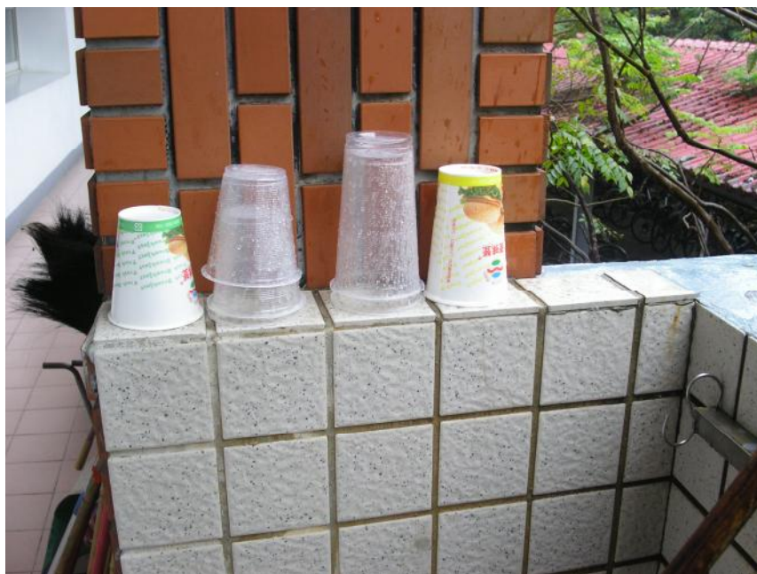
說明： 班級資源回收杯子分類