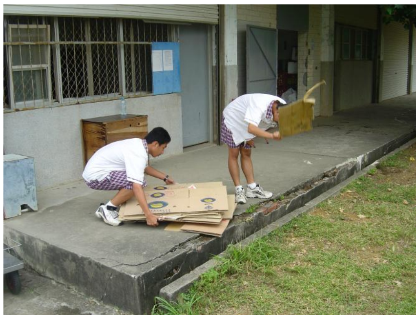
說明：資源回收情形