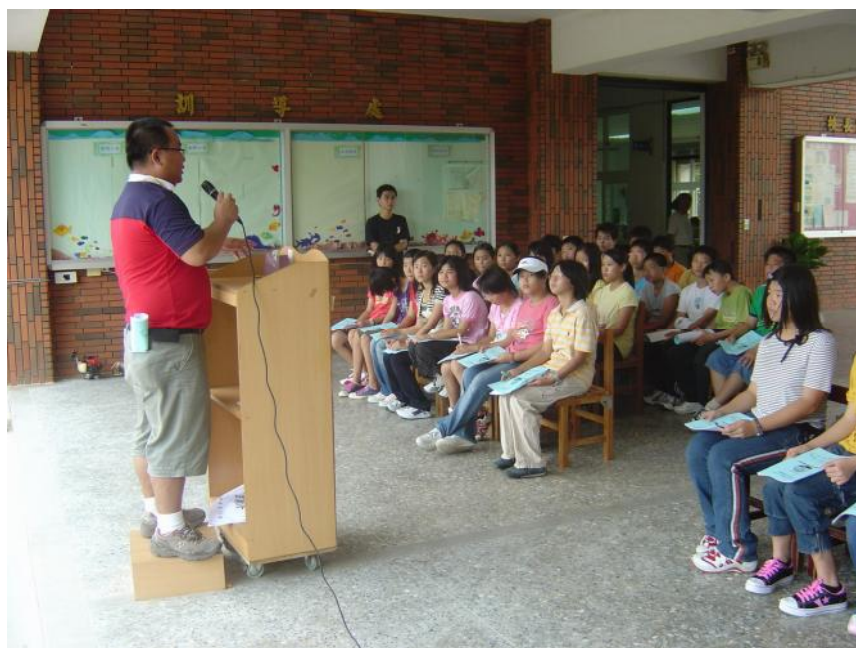
說明： 新生訓練說明資源回收