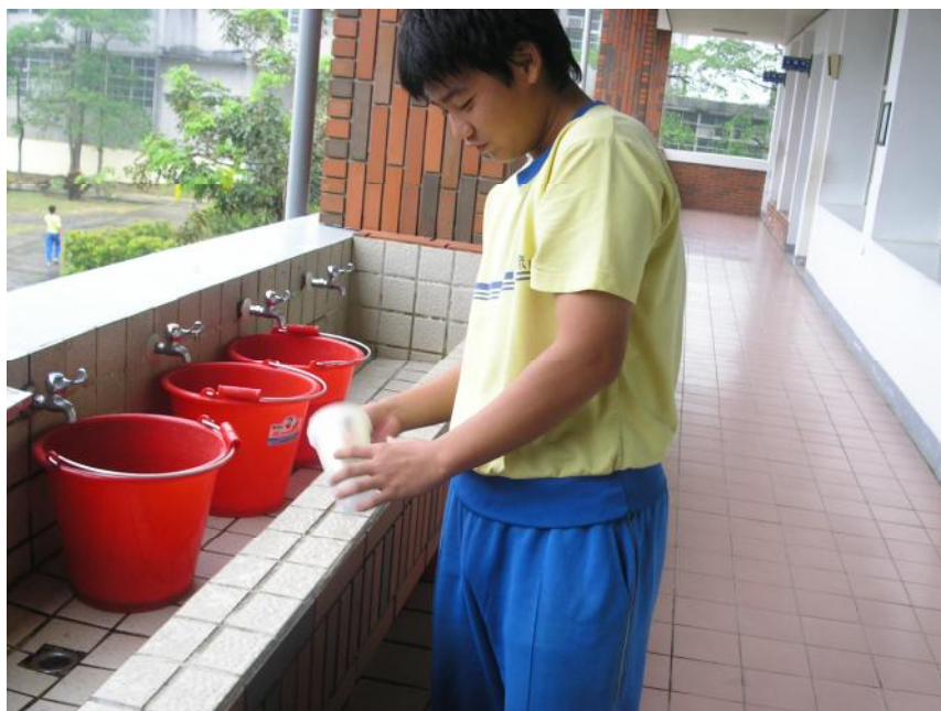
說明： 班級資源回收杯子分類