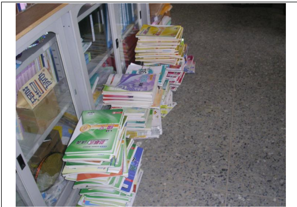
說明：九年級書本回收