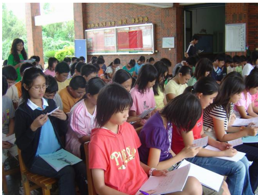
說明： 新生訓練資料填寫