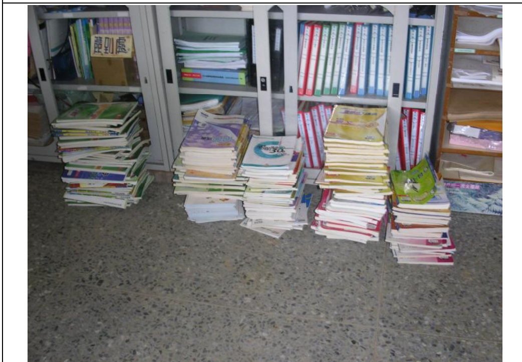
說明：九年級書本回收