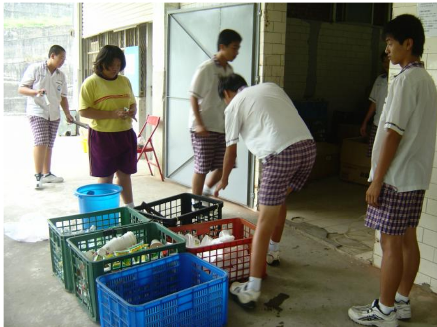
說明：資源回收情形