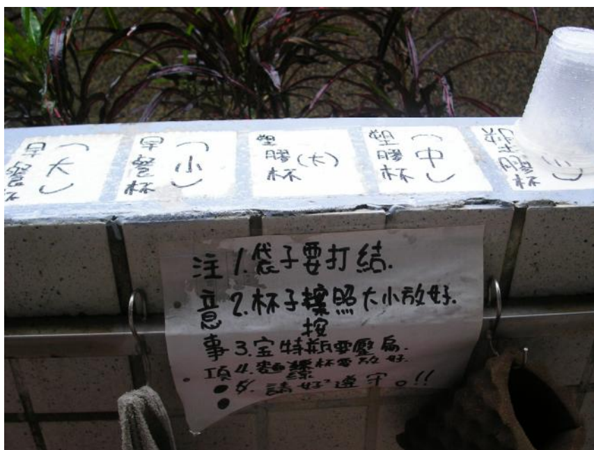
說明： 班級資源回收