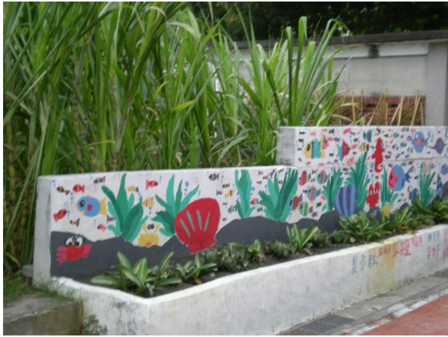
學校角落圍牆彩繪美化環境