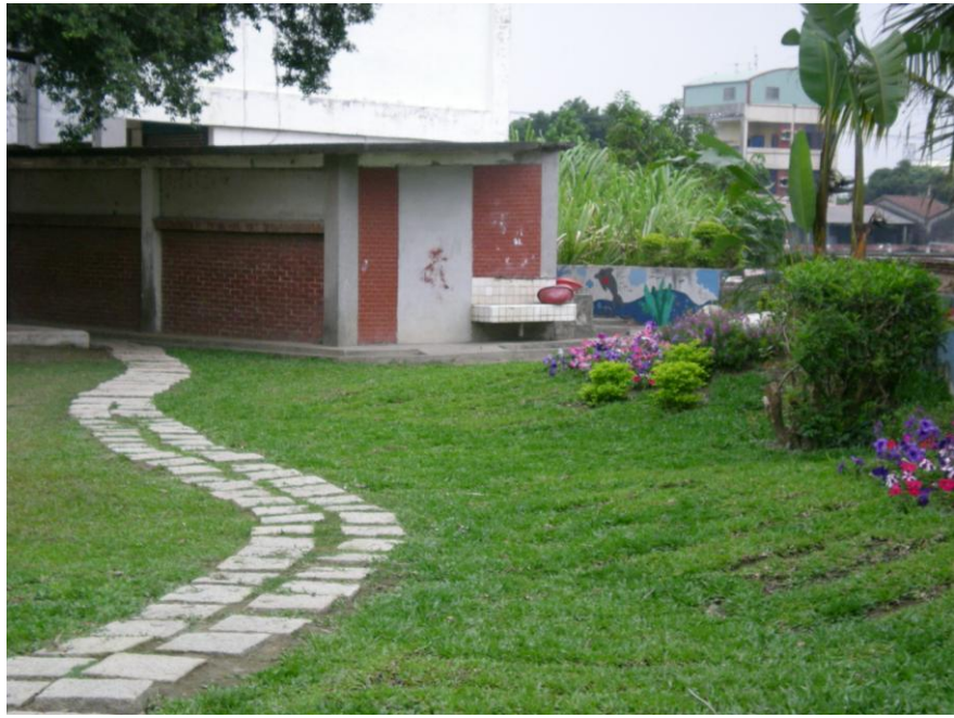
學校角落圍牆邊碧草如茵