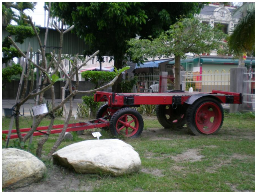
學校角落設置牛車以達境教