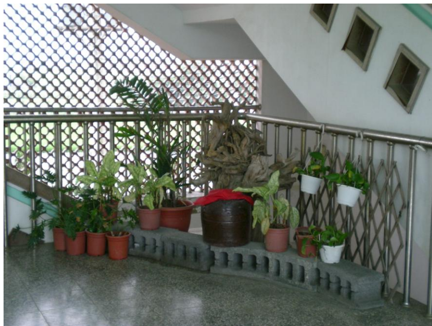
學校角落設置植栽區美化環境