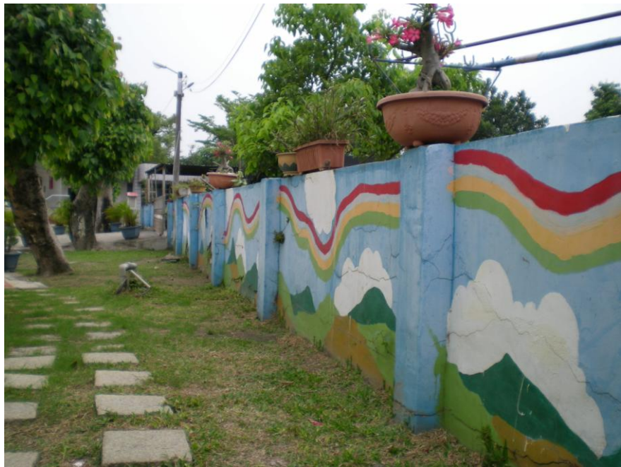
學校角落圍牆彩繪美化環境