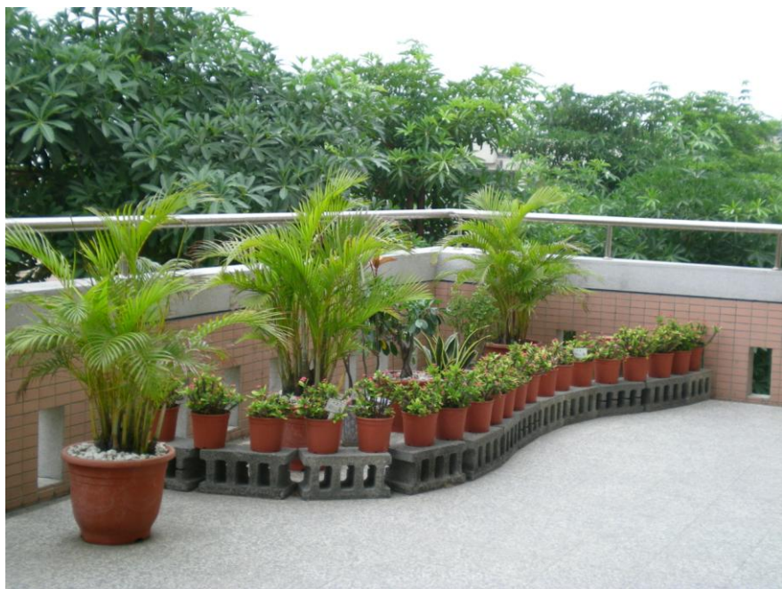
學校角落設置植栽區美化環境