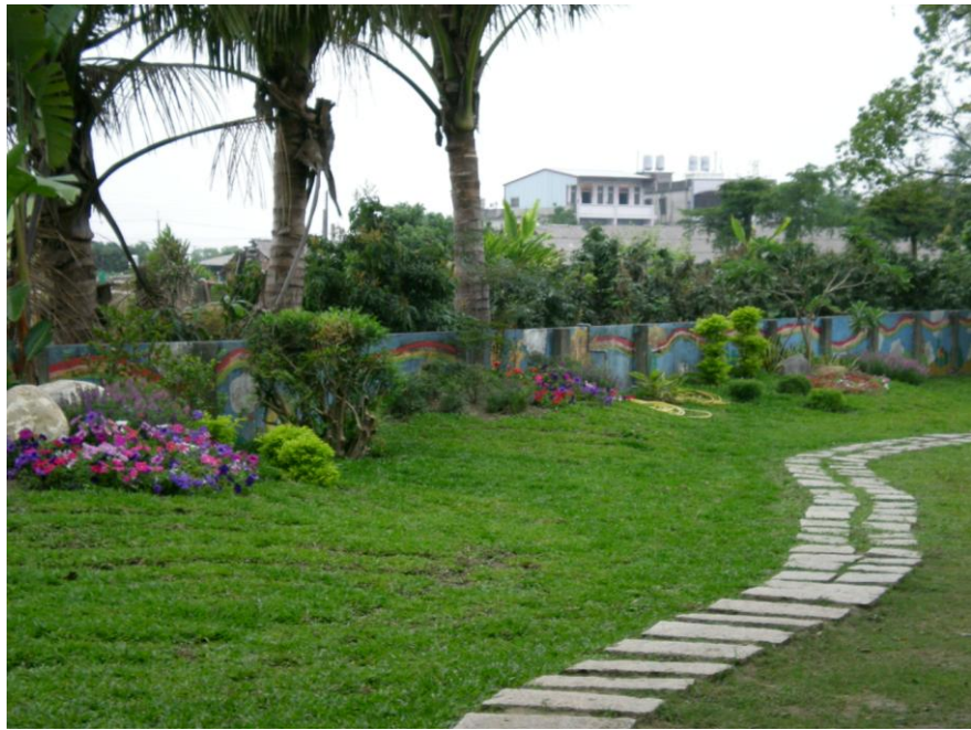
學校角落滾球場週邊花木美綠化