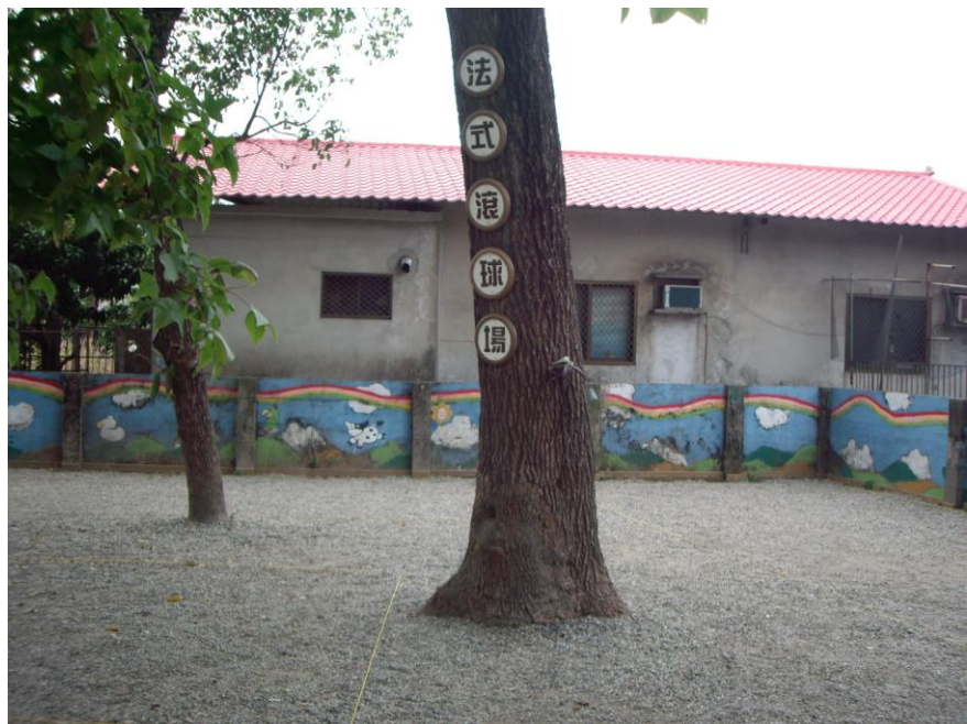
學校角落設置優美法式滾球場