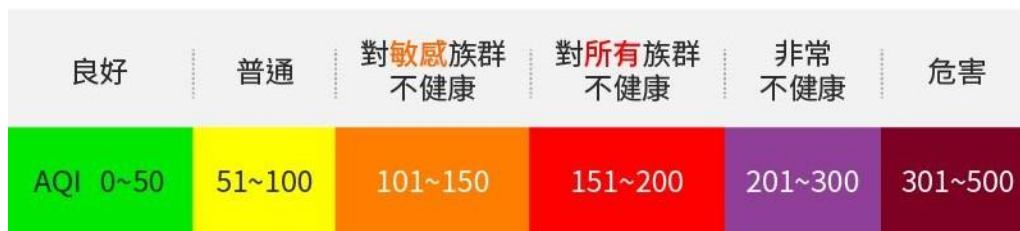
活動照片說明：空氣品質宣導教育週