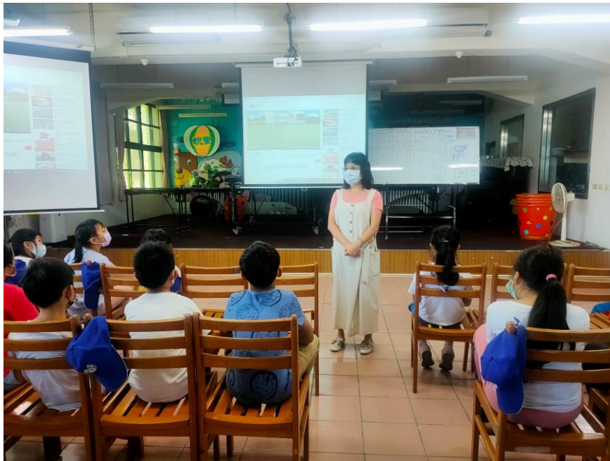
活動照片說明：週主題宣導