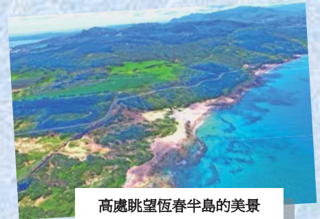
高處眺望恆春半島的美景

即日起於106年9月8日(星期五)前至本所全球資訊網( http://www.moeacgs.gov.tw )或臺灣地質知識服務網( http://twgeoref.moeacgs.gov.tw )頂下最新消息，或地質知識網絡臉書( https://www.facebook.com/twgeoref )進行連結，額滿為止。