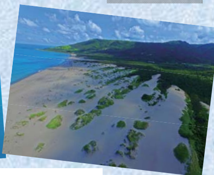
牡丹鄉旭海沿岸及滿州鄉九棚沙漠