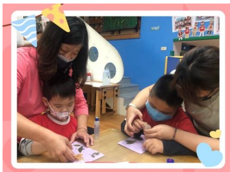
★手指要輕輕地拿喔★