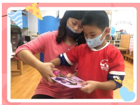
★哎呀!打洞機要用力一點★