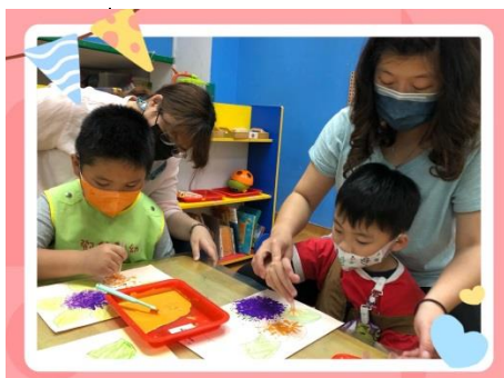
★換一個顏色蓋一蓋★