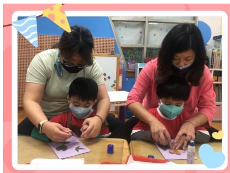
★花和葉子要貼在哪裡呢?★