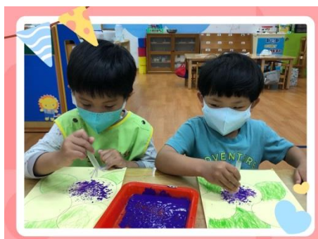
★吸管蓋蓋，蓋出繡球花★