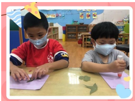
★我會自己創作我的書籤★