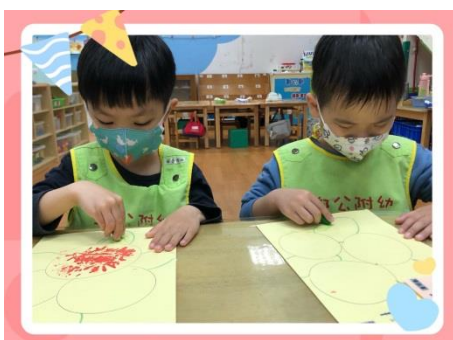
★要塗在框裡不能塗出去喲★