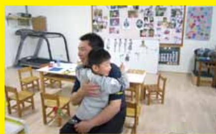
謝謝爸爸像媽媽照顧我