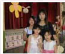
留下最溫馨的回憶