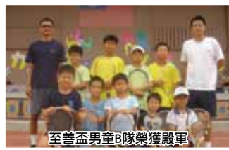
至善盃男童B隊榮獲殿軍