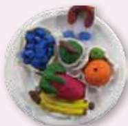
◎二仁/羅巧絮水果造型

沒有任何高遠的期望 只希望你們好好的成長 穩穩的踏上每一個學習的歷程 我雖然堅強、勇敢、自信、開朗、快樂... 但我也害怕、難過、焦慮不安的時候 我捨不得的是 你不懂得調配時間而天天晚睡 天天掙扎的起床 弄壞了身體 我難過的是 你不知道該好好學習而玩掉了歲月 任由大人殷切的叮嚀仍我行我素 我心疼的是 你遇到困難不懂得找師長幫忙解決問題 自己卻一直無法破繭而出 傷害了自己的身心 我害怕的是 你不知道該充實自己的生命 而茫然過著追求時髦、玩手機、上網玩樂... 沒目標的日子 真的太可惜了 我傷心的是 你還沒有養成好的品德 不知去代人著想及看人家的好處 不知有能力時該去幫助別人 卻處處與人計較、爭吵、一有時間就講個不停 不知言多必失的道理 我要告訴你 只要有堅固的正確知見 就不怕掉入大染缸而無法跳脫 相反的 若你堅持正確的知見 則你會像蓮花一樣一出淤泥而不染 好美啊！ 我想 我願意當你的靠山 在你需要幫忙時 我就在你左右 我可以引導你、拉住你 好讓你再度踩穩腳步 繼續往前邁進 別忘了！我永遠在這裡！