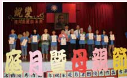
頒發藝文比賽優勝的小朋友