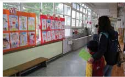
和媽媽介紹自己所畫的媽媽畫像