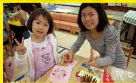
和媽媽一起完成母親卡