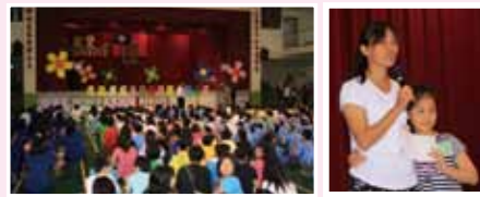
校長祝福媽媽們母親節快樂