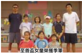
至善盃女童榮獲季軍