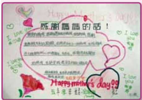
小朋友用心製作的感恩卡