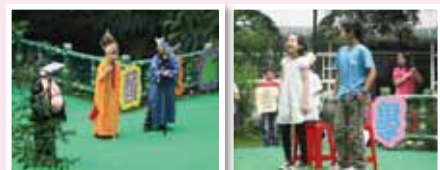
歌舞劇-孫悟空三借芭蕉扇