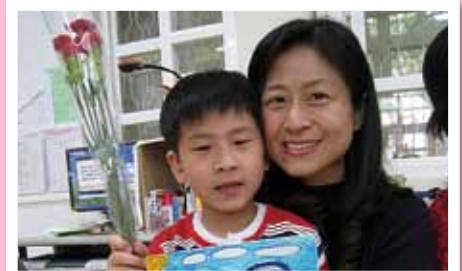
獻花與送卡片給我愛的媽咪