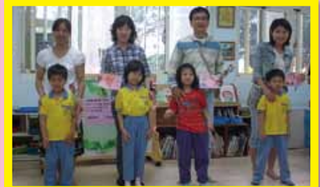
感謝爸爸媽媽--獻花和卡片