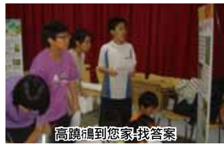
高謙禎到您家找答案