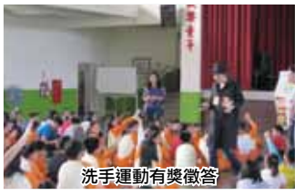
洗手運動有獎徵答