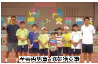
至善盃男童A隊榮獲亞軍

今天晚上我跟媽媽說：「我可以幫你切菜嗎？」媽媽說：「可以啊！」我好開心，立刻拿起菜刀大顯身手。我切了絲瓜和蔥，媽媽還教我練習打蛋，媽媽說我不但菜切得好，蛋也打得很勻。接著，我又問媽媽還可不可以切高麗菜？媽媽說，因為高麗菜擺太久，已經不新鮮，營養也流失，不能吃了，所以不用切。我雖然有點失望，但是也學到，不新鮮的東西不營養，也不能吃。 今天是我第一次幫媽媽切菜，所以晚餐吃起來，特別香，也特別好吃。我覺得自己長大了，可以幫媽媽做好多事，也希望下次還可以再幫媽媽切菜。