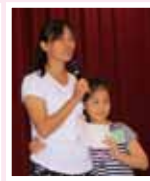
聽到女兒親口說出感恩的話語，令媽媽動容