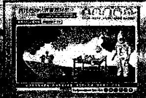
病媒防治與樂器演奏