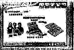
人力資源管理概論

歲末將至，我們誠摯地推薦您，快加緊腳步登入研習中心觀看今年度的數位課程(可參考下方課程列表)，希望透過這五大類課程，能協助您更精進專業領域之發展，提高自我成長與工作自信。