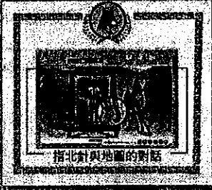
指北針與地圖的對話