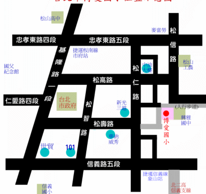
臺北市博愛國小位置示意圖