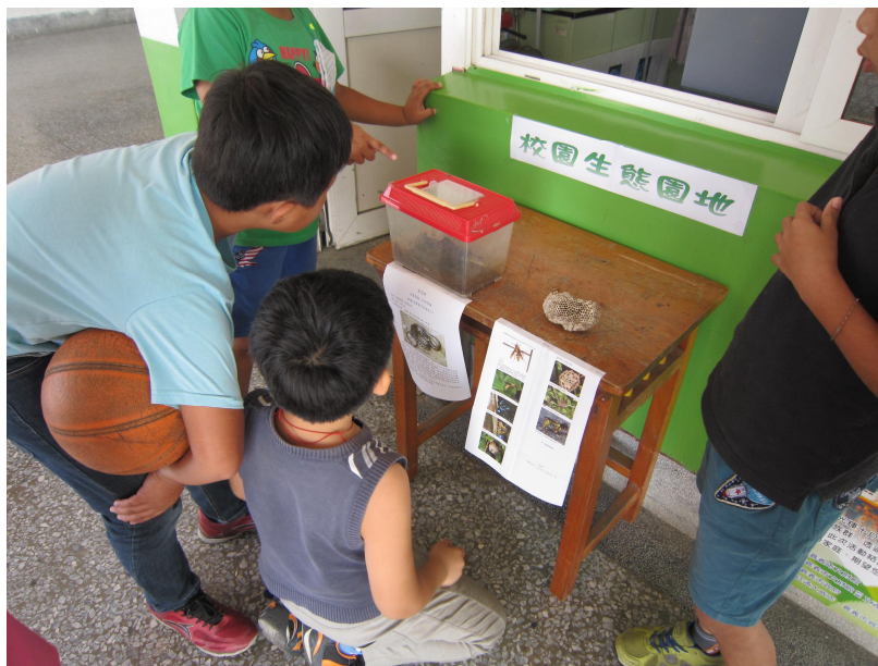
運用學校出現的生物進行環境教育—長腳蜂