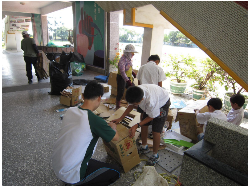
長期推動校園垃圾減量及資源回收工作

5. 每年辦理各種與環境教育有關的主題活動，讓環境教育融入課程中，讓學生更能瞭解我們的環境，培養正確的環境態度，與地球和平共處。