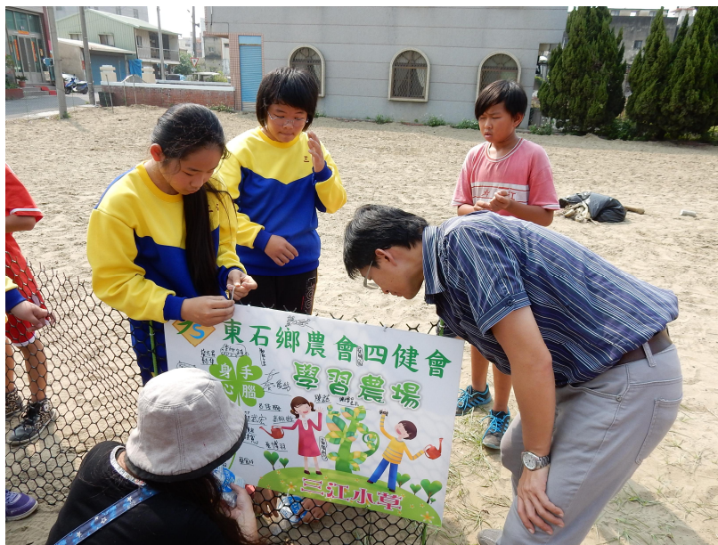
「農村青少年教育計畫」-讓小朋友親手架設農園圍籬