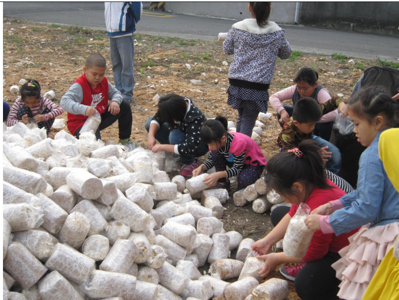
活動照片 「農村青少年教育計畫」-運用農會杏鮑菇之農業廢材當做土壤改良。

活動內容 與成果 6. 申請「農村青少年教育計畫」規畫教學農園，讓師生一同至田裡，從農業資材回收再利用、播種、澆水、除草以及收成，實際體驗農夫工作的辛勞，瞭解「人與自然」的關係。