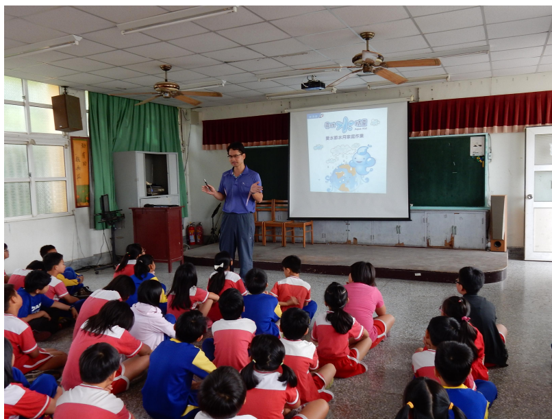
全校推動「尋找水精靈」活動