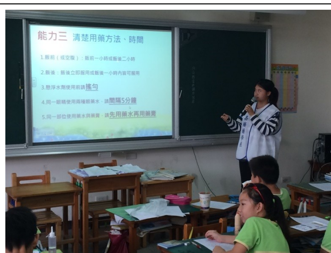
說明：正確用藥五大核心能力三