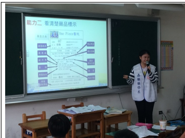
說明：正確用藥五大核心能力二