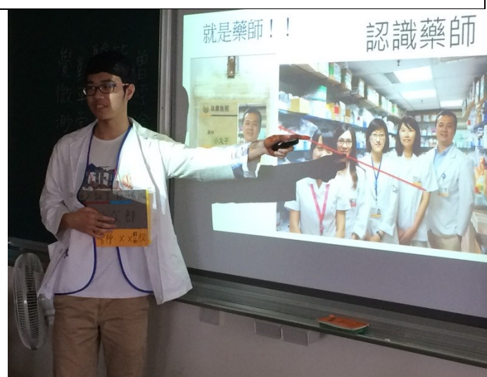
說明：正確用藥五大核心能力五