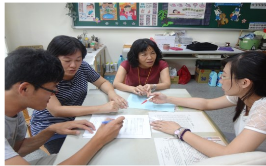
教師群課後的反省與討論。