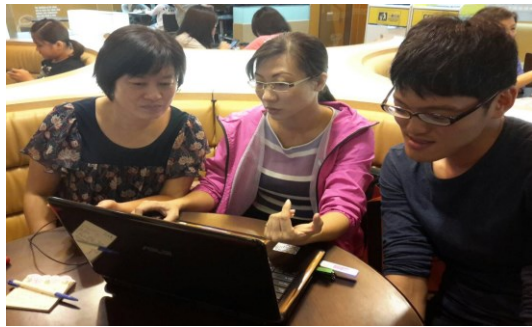
教師群事前的分工與課程設計。