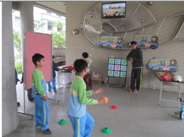
說明：學生熱情參與