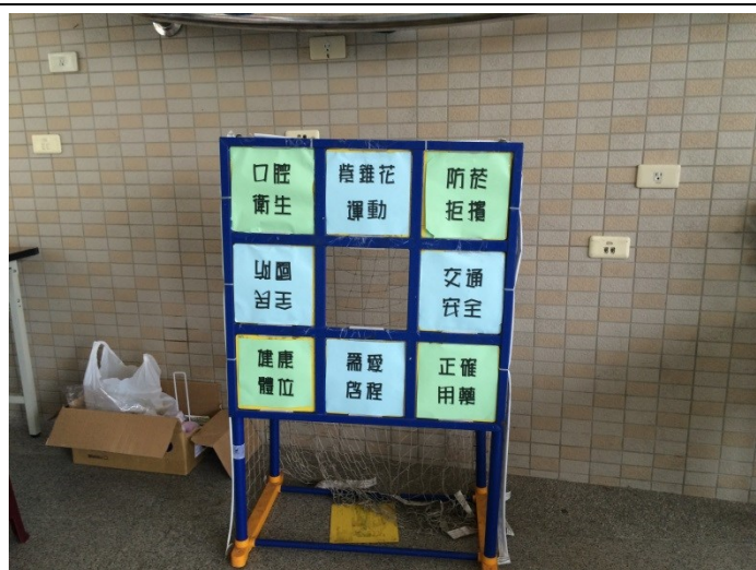
說明：九宮格有獎徵答活動