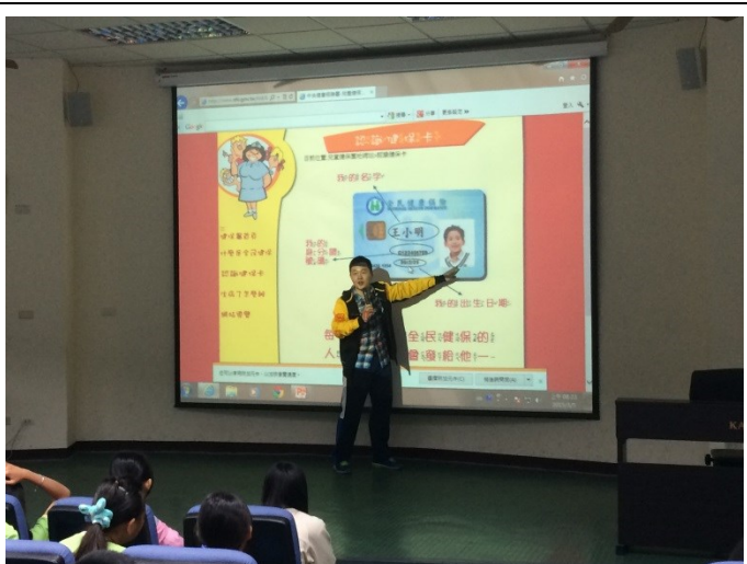
說明：兒童健保園地介紹