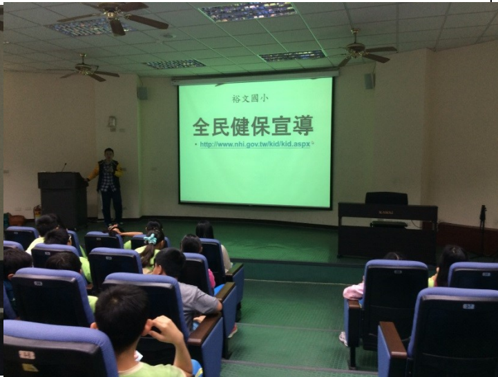
說明：全民健保介紹