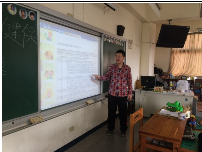
說明：健保心得感想發表