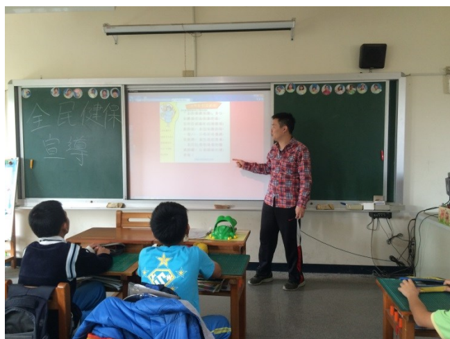
說明：全民健保介紹