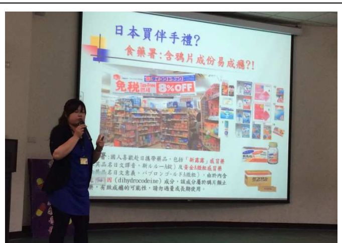
說明：藥品並非伴手禮