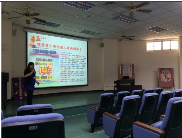
說明：健保二代新制介紹