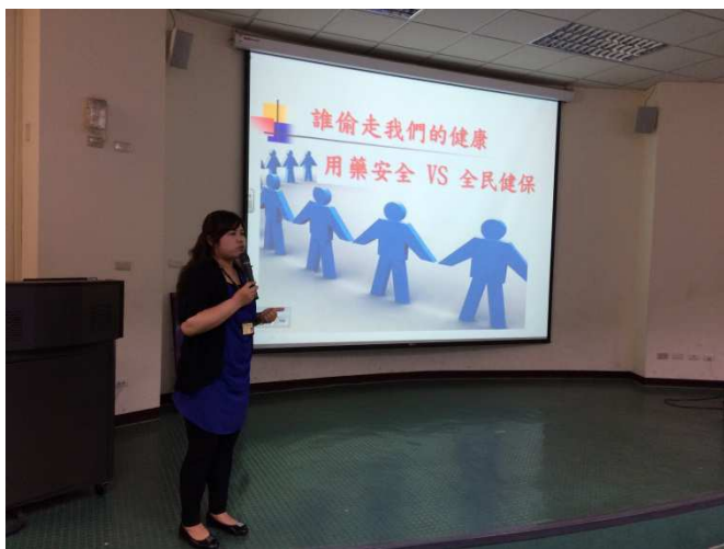
說明：慶生醫院講師到校演講