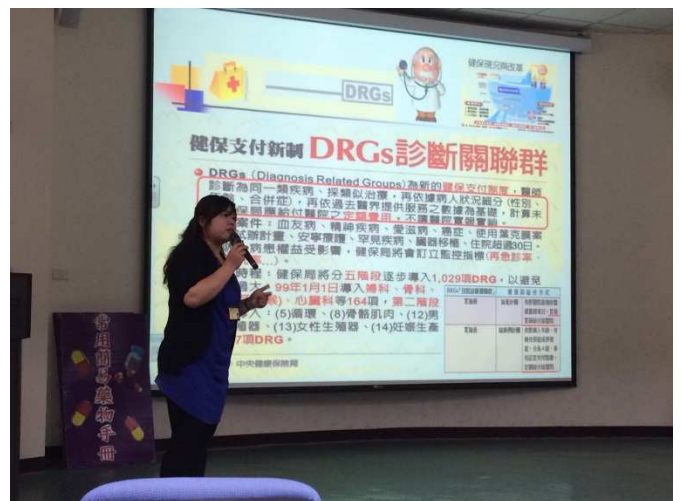
說明：健保給付新制介紹