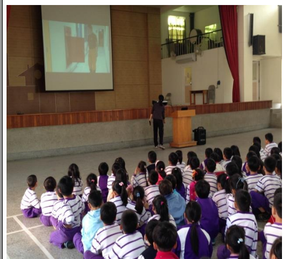
臺南市大新國小 103 年度火災避難掩護演練及 防火宣導成果