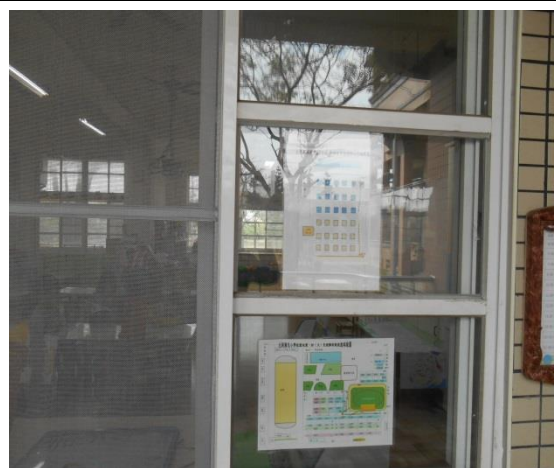
大新國小防災及防火疏散路線圖與布置