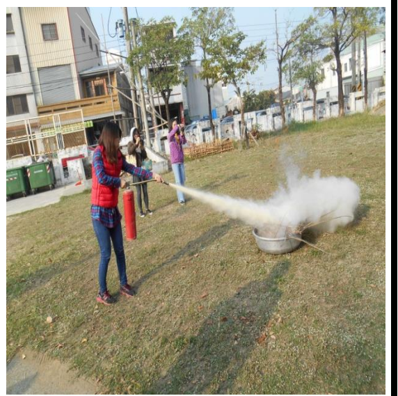
教師安全教育〈防火〉研習