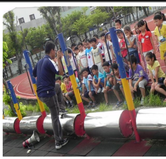
新生訓練—健康中心參訪、正確使用遊戲器材