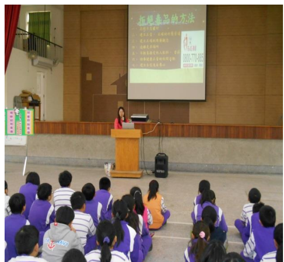
新化衛生所藥物成癮〈拒絕毒品〉宣導