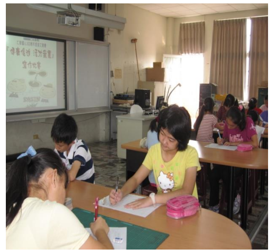
安全用藥寫作比賽