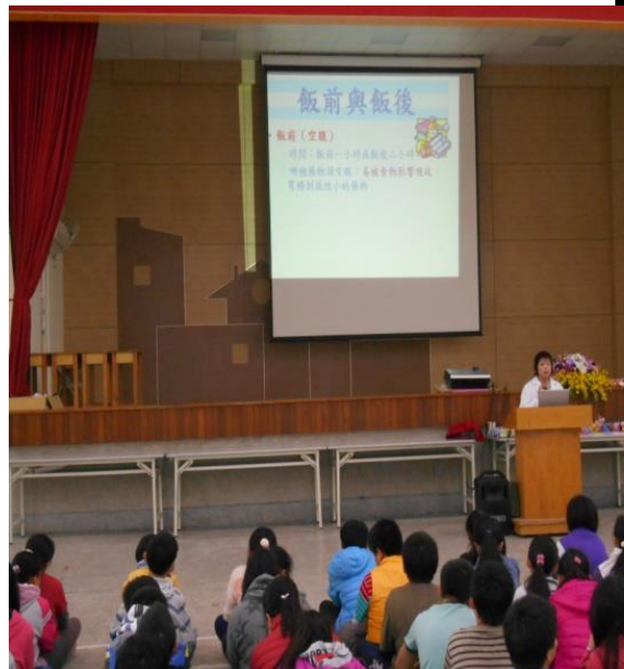
社區藥師到校宣導正確用藥五大核心能力