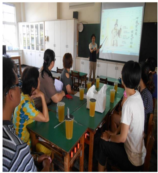
「用藥五不」班親會宣導