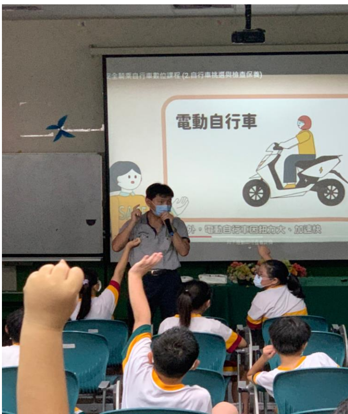
活動說明：五年級學生交通安全維護講習