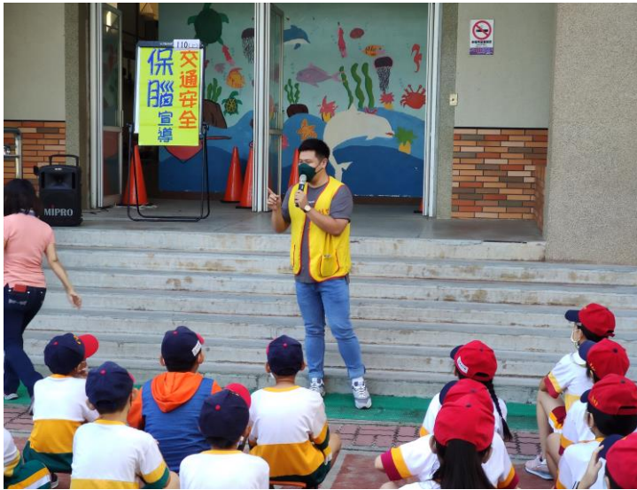
活動說明：創世基金會派員到校進行交通安全保腦宣導