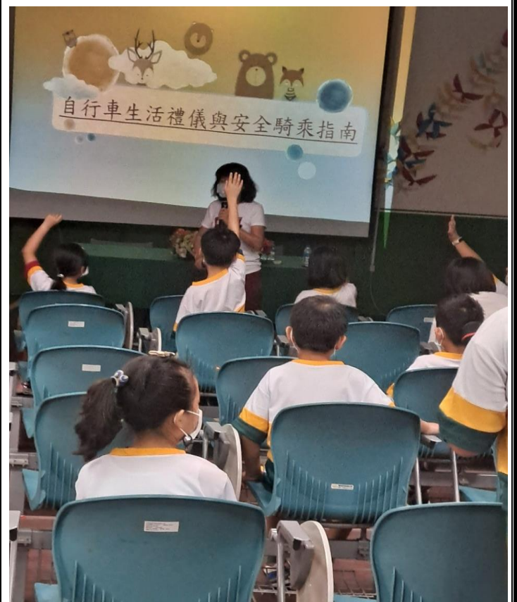
活動說明：四年級學生交通安全維護講習