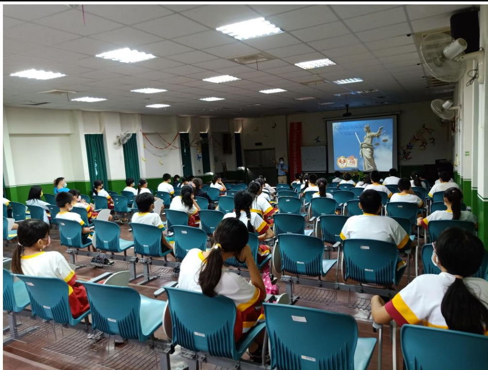
活動說明：六年級學生交通安全維護講習