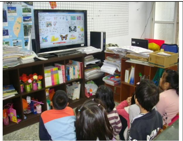
網路教學~~介紹蝴蝶種類