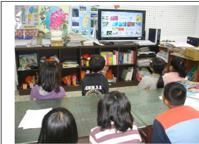
網路教學~~介紹蝴蝶種類