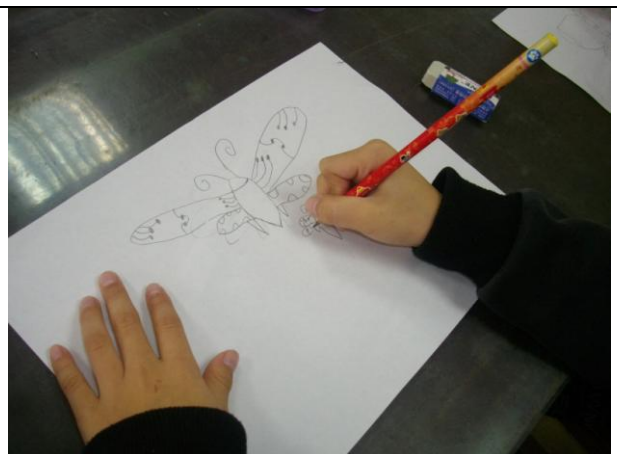
學生畫下喜愛的蝴蝶圖案