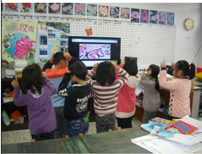
學生律動~哼唱蝴蝶歌