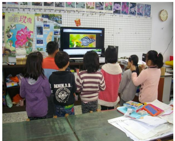
學生律動~哼唱蝴蝶歌