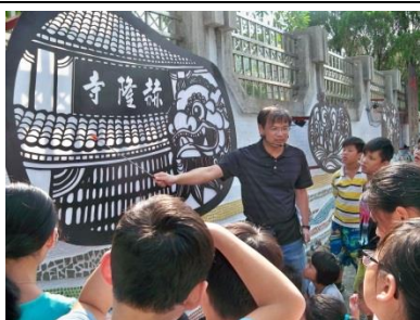
老師解說特色鐵雕的內涵