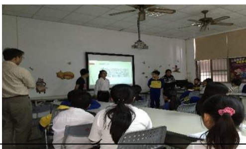
專題報告成果發表