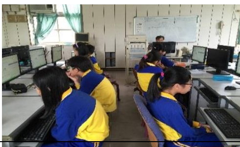
指導學生製作簡報