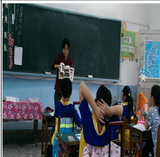
討論並歸納飼養蝴蝶與觀察的注意事項