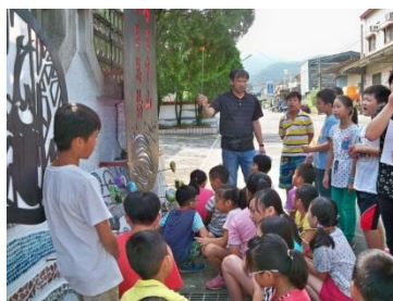
老師解說石碇光廊故事牆的特色