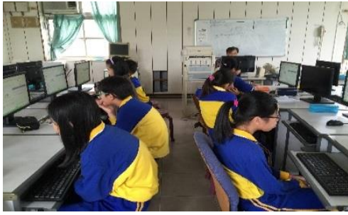
指導學生製作簡報