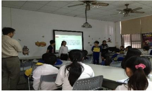
專題報告成果發表