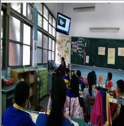
介紹常見的蝴蝶分類