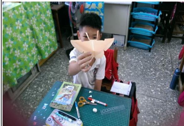
介紹自己的蝴蝶作品。