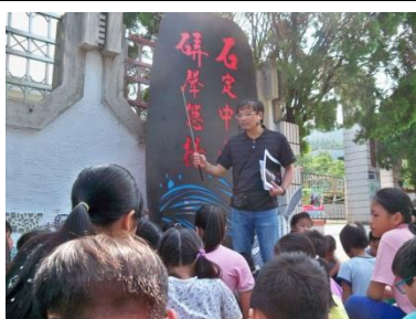
老師解說石碇光廊故事牆創作理念