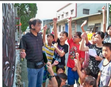
老師提問與學生回應