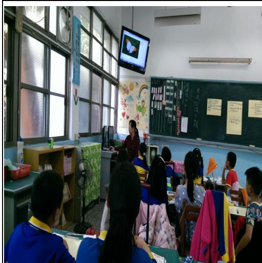
介紹常見的蝴蝶分類