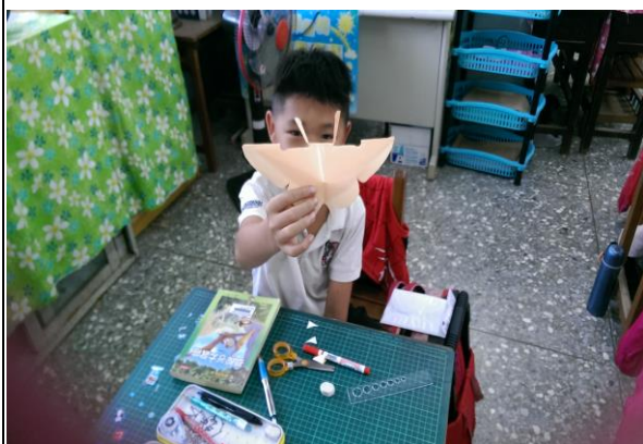
介紹自己的蝴蝶作品。