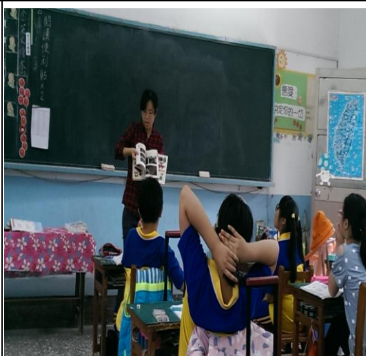
討論並歸納飼養蝴蝶與觀察的注意事項