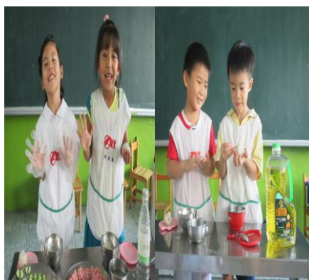
科學實驗-飯如何不會黏手呢?