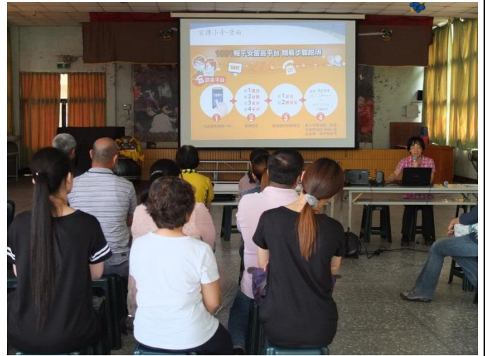
說明：向家長推廣 1991 報平安留言平台