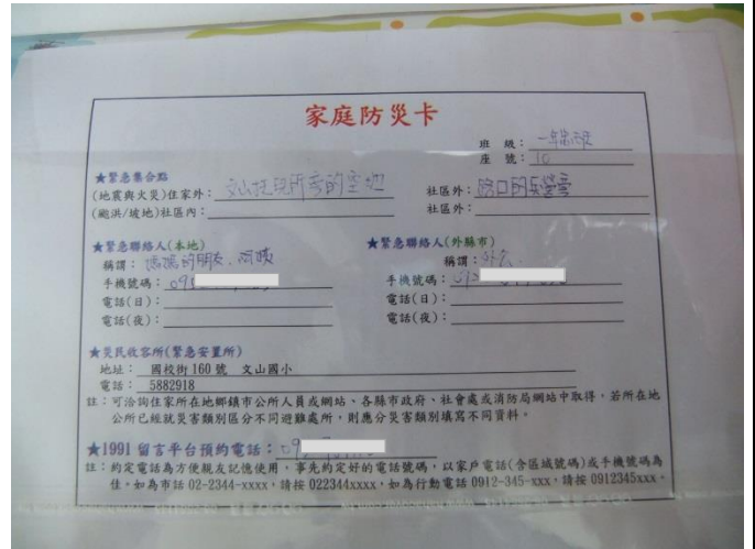
說明：黏貼在聯絡簿上的家庭防災卡