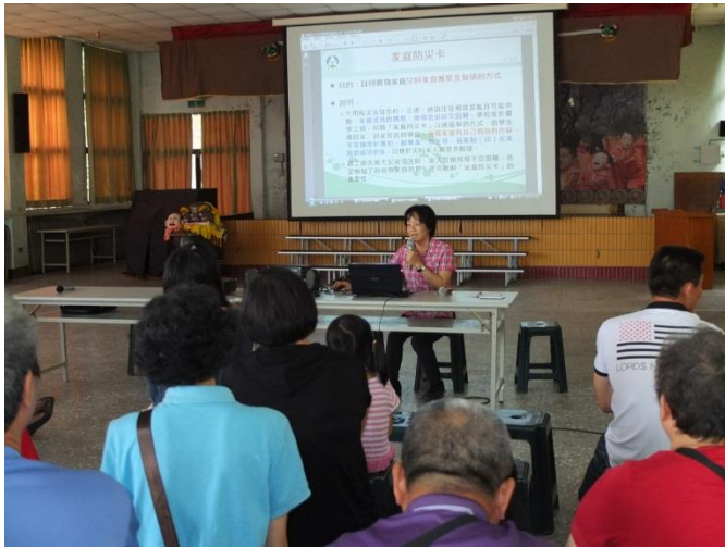
說明：向家長介紹新版家庭防災卡