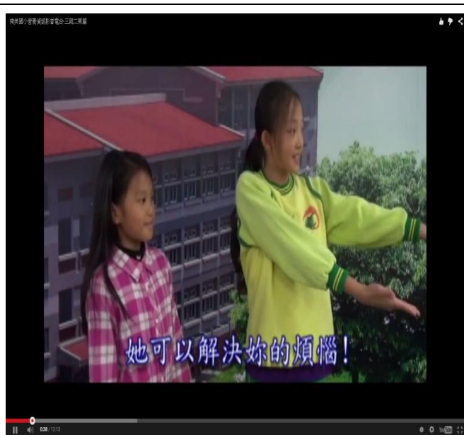
說明：自製天天五蔬果營養電台及公播。