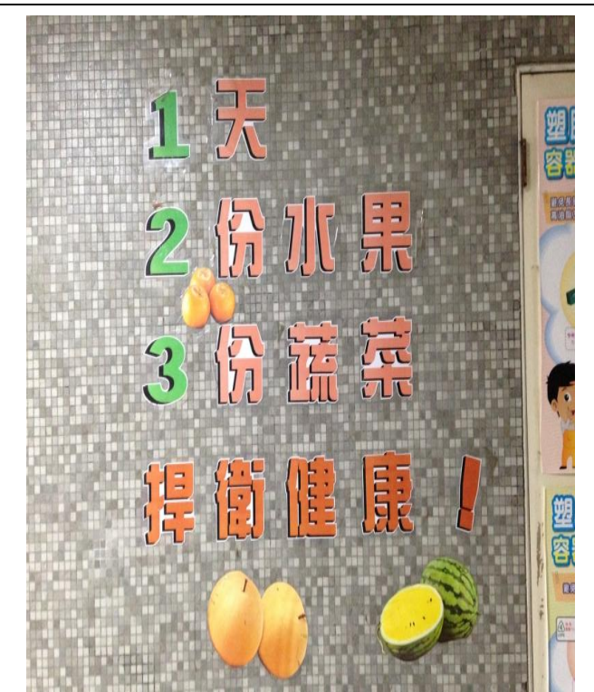
說明：天天五蔬果營養教育牆。