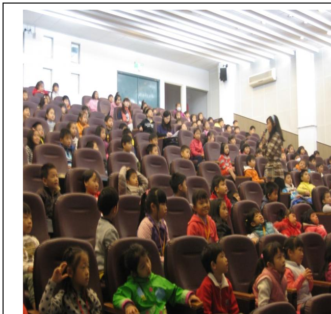
說明：營養師天天五蔬果宣導。