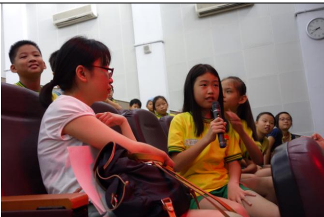
說明：學生踴躍發表