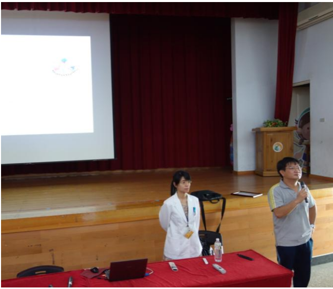
說明：主任介紹講師-長庚醫院陳藥師