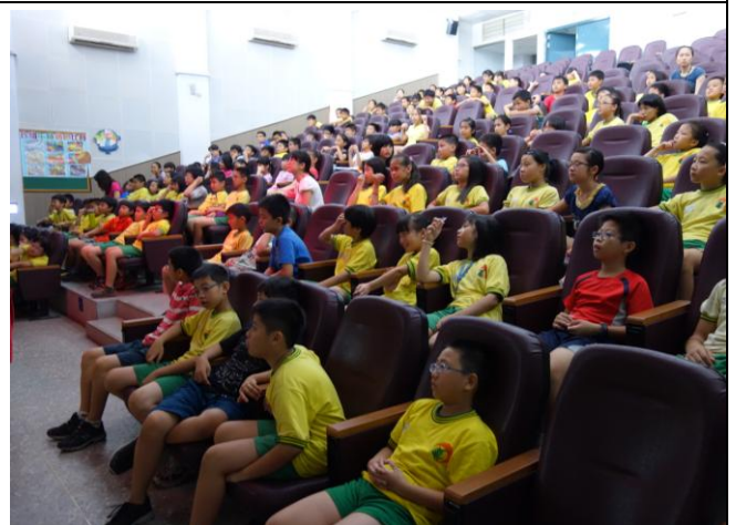
說明：學生仔細聆聽