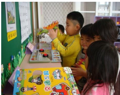
認識各種不同的書