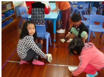
小幫手-一起來幫忙打掃教室