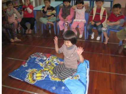
魔毯時光-說出自己的願望