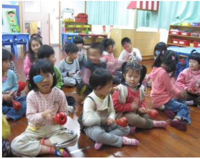
用節奏樂器來做音效