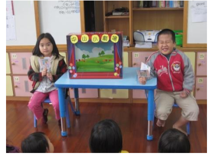
故事排一排-大家來說故事!