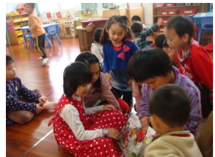
芸瑄帶來觸覺書與同學分享