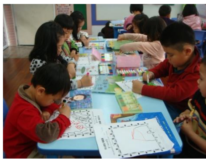
小朋友認真的畫出愛書的封面