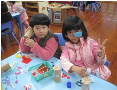
利用各種材料幫傳聲筒做上裝飾