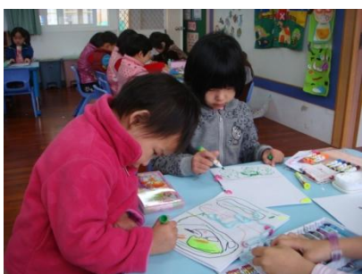
小朋友很投入的設計自己的小書