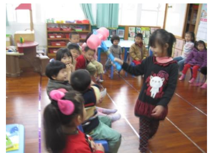
小朋友最喜歡的遊戲-打擊魔鬼