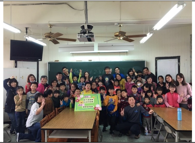
說明：親子桌遊趣，玩出好品格，活動內容精彩，家長參與度高