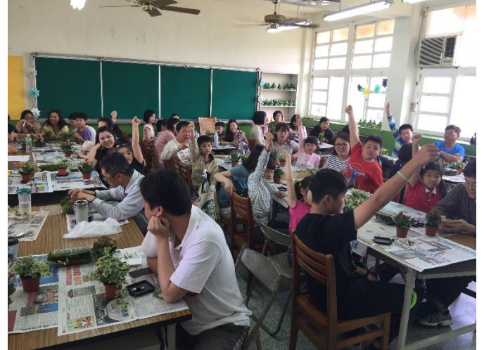
說明：活動內容有趣，關於盆栽植物搶答熱烈