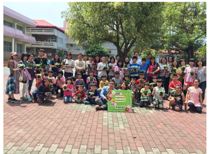
說明：創意盆栽活動內容新穎，家長、小孩參與度高，也收穫滿滿