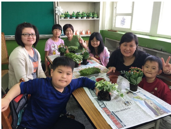
說明：透過製作創意盆，學習更尊重大自然，與家人關係又更緊密了