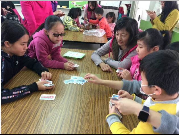
說明：透過不同桌遊遊戲，學習正向品格，並遵守規則。