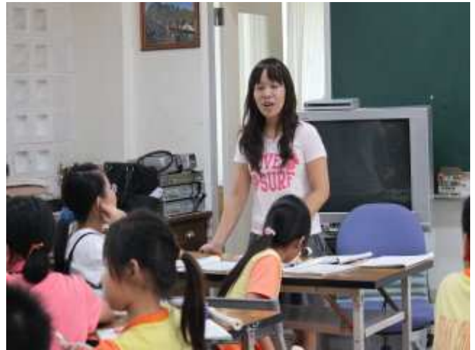
老師指導學生分部練習