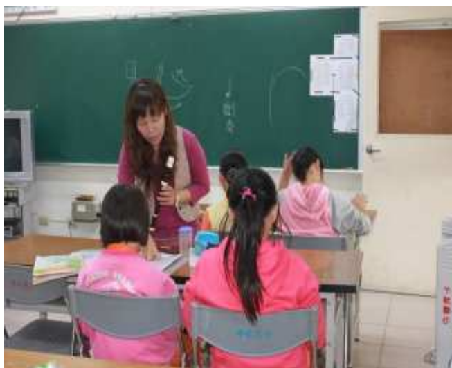
指導學生吹奏直笛