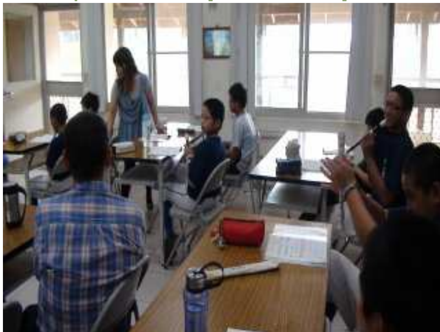
協同教學老師參與藝術與人文教學及協助教學推動