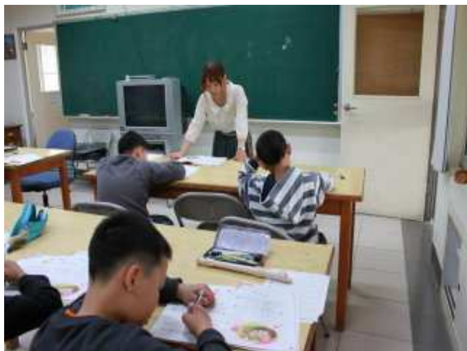
四年級音樂欣賞後寫心得