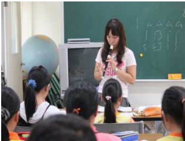
老師指導學生直笛指法