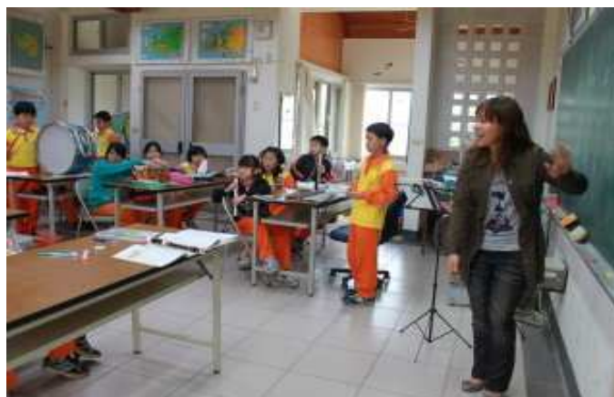
三年級節奏樂練習