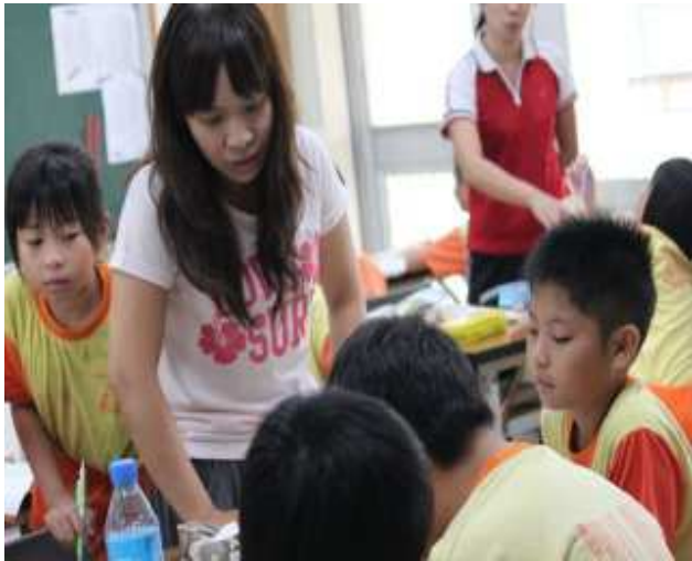
老師指導學生識譜