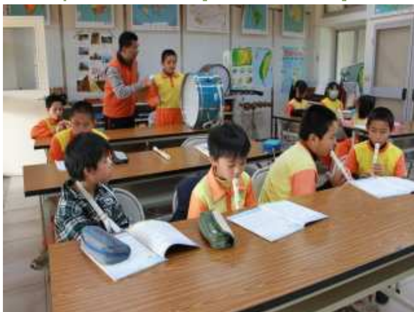
協同教學老師參與藝術與人文教學及協助教學推動