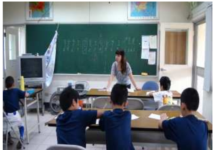
本校老師協同教學