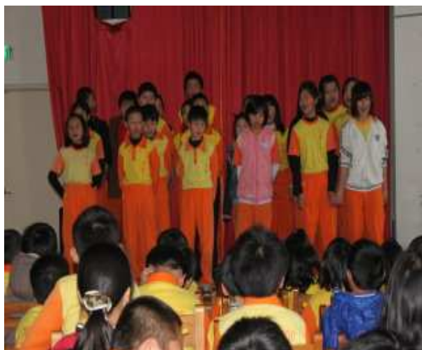
歌曲演唱——快樂天堂