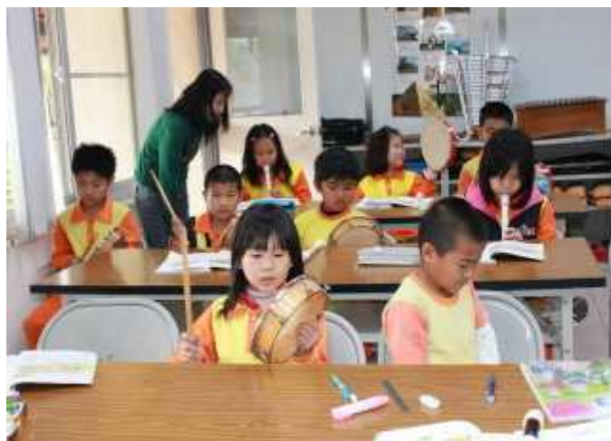
五年級節奏樂練習