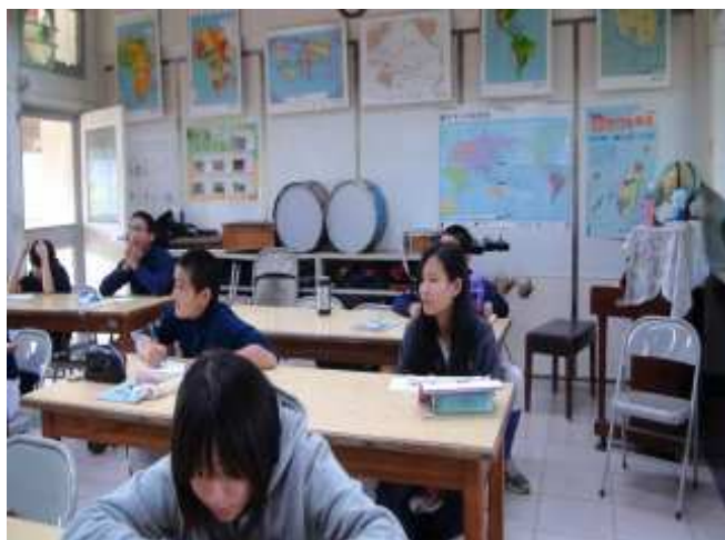
六年級節奏樂練習