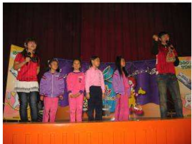
◆ 11/5(五)三年級口腔保健宣導。地點：活動中心。學生與麥當勞丫姨互動情形。