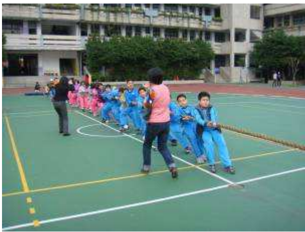
◆11/25 五年級拔河預賽，大家一條心，團結就是力量，我們不會輸對方的！