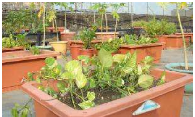
積穗樓栽培樓之休閒迴廊