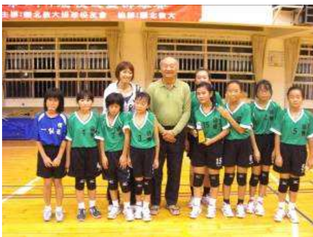
◆12/4-7 校友盃排球比賽，五年級女生獲得亞軍，曾教練與球員合影。