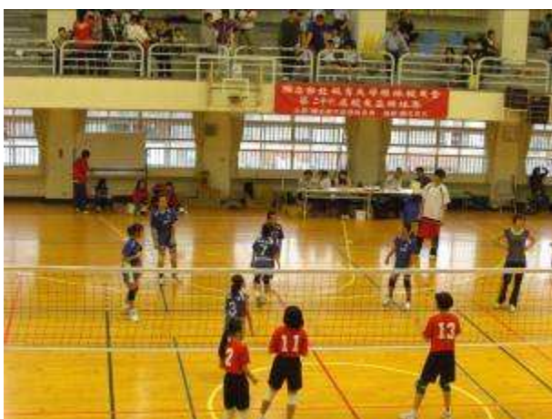
◆ 12/4-7 校友盃排球比賽，五年級女生比賽情形，地點：國北教育大學。