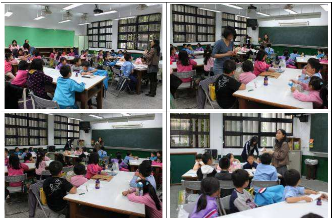
書法班 B 班 (二、三年級) 開課-991105