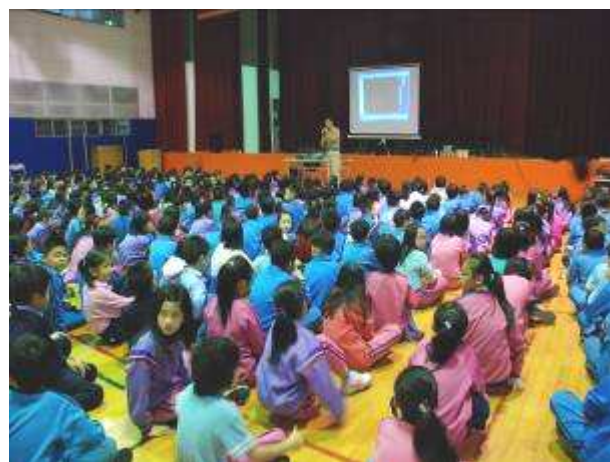
◆11/16(二)三年級租稅教育宣導。地點：活動中心。學生專注情形。