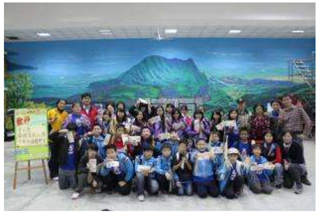
至瓜山國小參加「環境教育推廣學校山林田野課程與教學方案校際交流」活動-991116