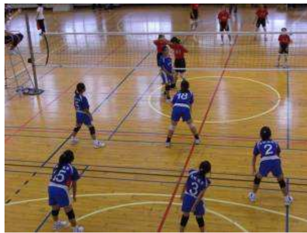
◆12/4-7 校友盃排球比賽，五年級女生比賽情形，地點：國北教育大學。