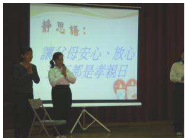
◆ 11/23 (二) 三年級感恩教育宣導：大愛媽媽話劇表演。地點：活動中心。