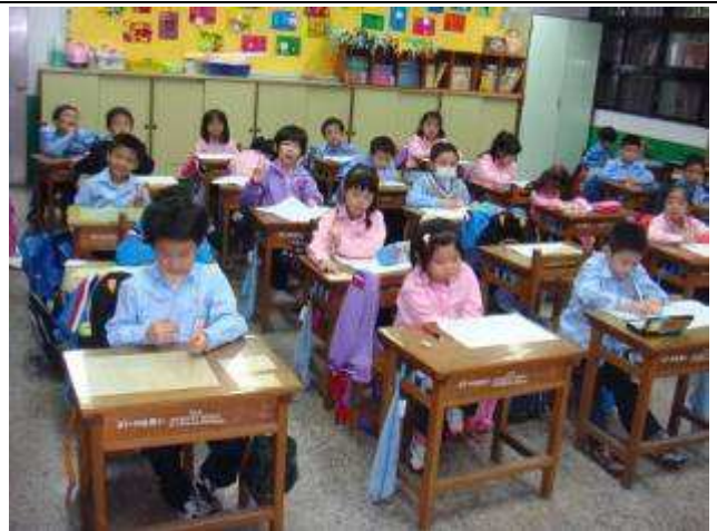
一年級注音符號能力檢測-991116