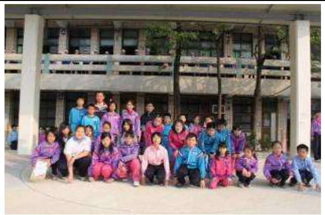
頒獎-美術比賽校內得獎同學合影-991109