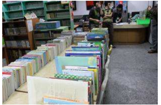
江永昌議員配合款購買書籍驗收照片-991119