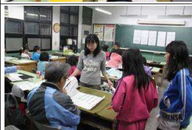
四、五、六年級書法班 (A 班) 上課-991126