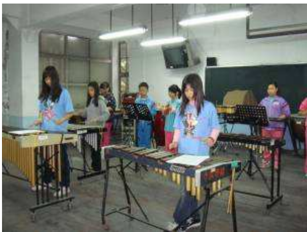
◆ 11/22 六年級打擊樂團晨練一隅。