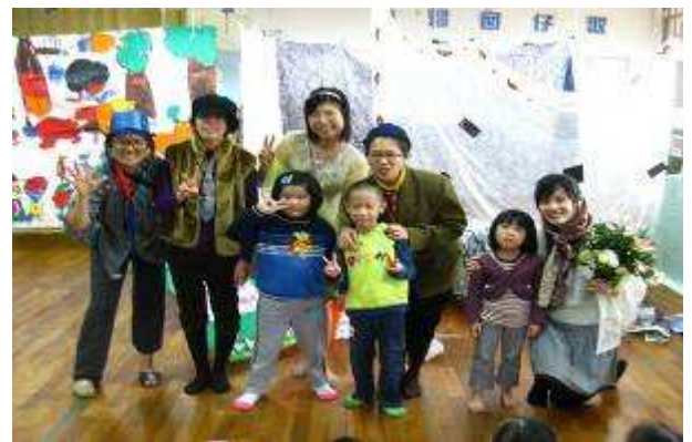
11月兒童劇場—慌張先生