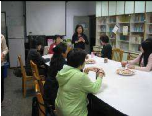
11月26日(星期五)早上9:00,於輔導處會議室,舉行11月份志工組長會議