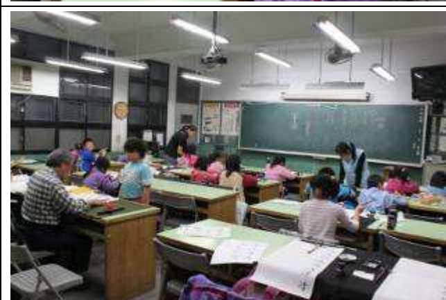
書法班 A 班（四、五、六年級）上課-991119