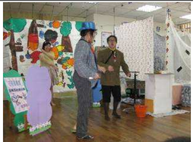
11月兒童劇場—慌張先生