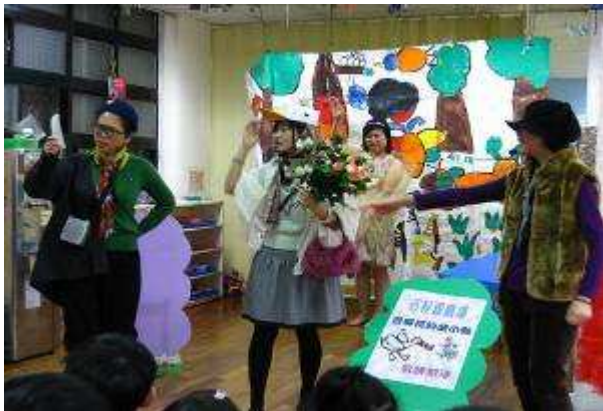
11月兒童劇場—慌張先生