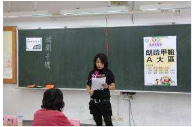
補校學生至蘆洲忠義國小參加新住民藝文秀活動-991114