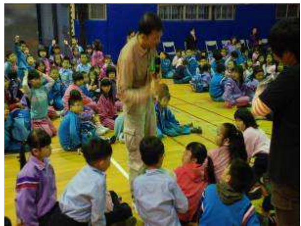
◆ 11/16(二) 三年級租稅教育宣導。地點：活動中心。講師與學生互動情形。