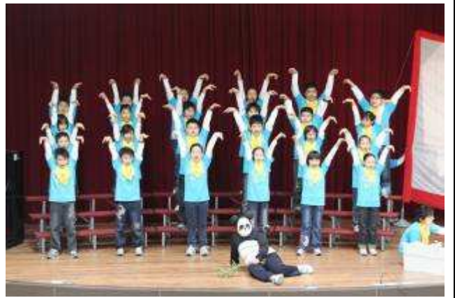
五年 16 班參加高年級組英語歌曲演唱競賽-991117