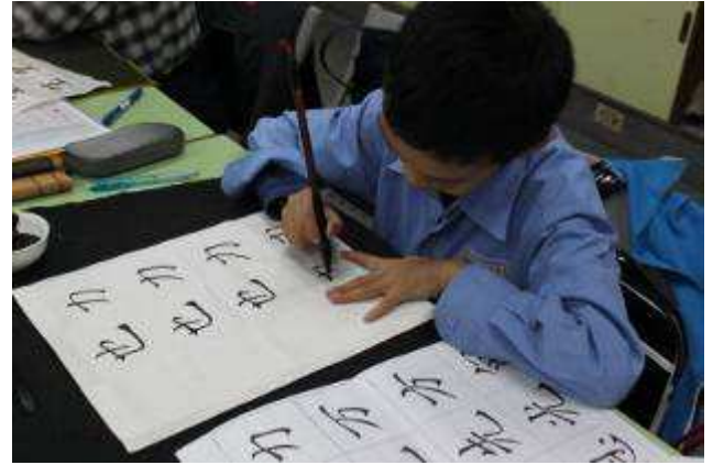
書法班 A 班 (四、五、六年級) 上課-991112