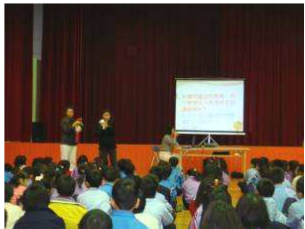
◆ 11/23 (二) 三年級感恩教育宣導：大愛媽媽話劇表演。地點：活動中心。學生專心觀看表演。