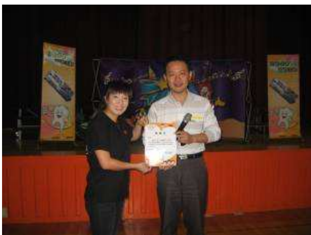
◆ 11/5(五)三年級口腔保健宣導。地點：活動中心。校長贈予麥當勞感謝狀。