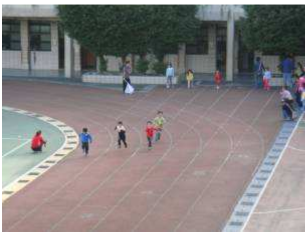
一年級 60 公尺預賽，不可跑到別人的跑道喔！『不知他們是在追逐或在比賽？』