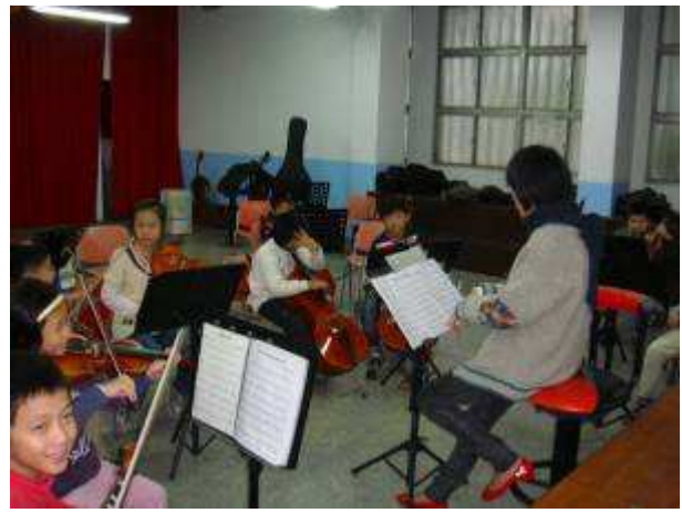
◆11/24 弦樂 B 團晨練，不可分心。