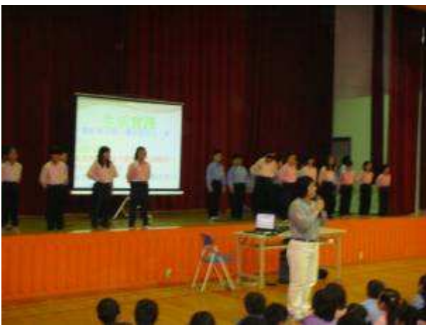
◆ 11/23 (二) 三年級感恩教育宣導：大愛媽媽話劇表演。讓學生知道『知恩、感恩、報恩』地點：活動中心。