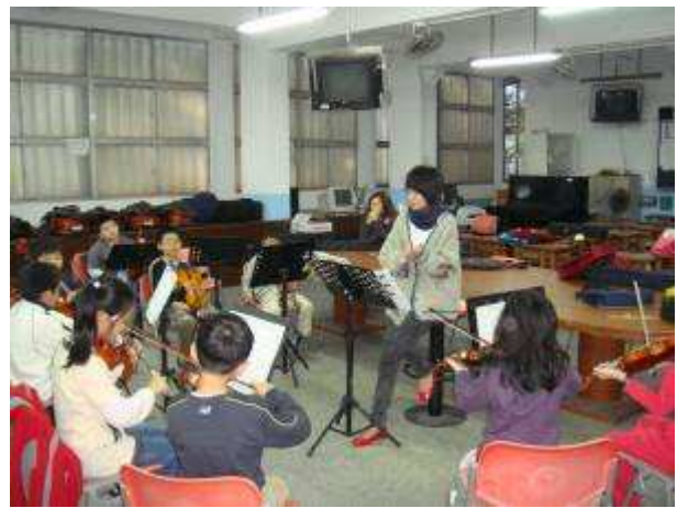
◆11/24 弦樂 B 團晨練，合奏時音要整齊。