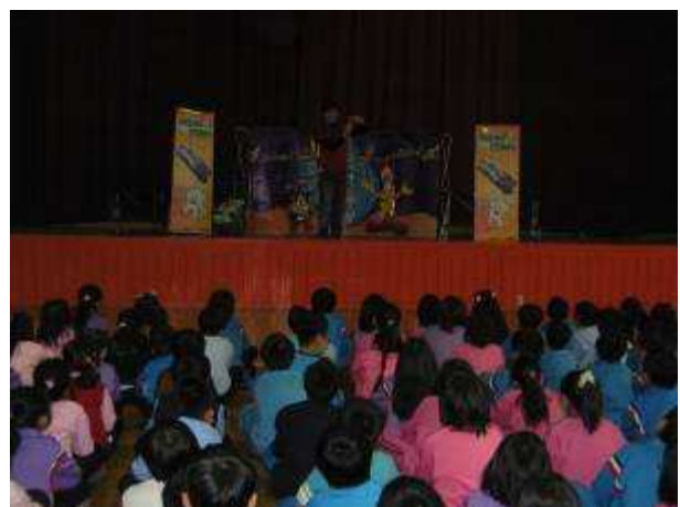
◆ 11/5(五)三年級口腔保健宣導。地點：活動中心。學生專注欣賞話劇。