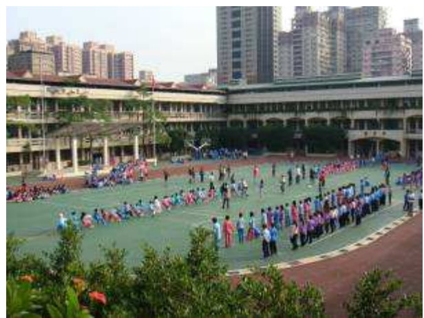
六年級年級拔河預賽，大家屏氣凝神等待結果！