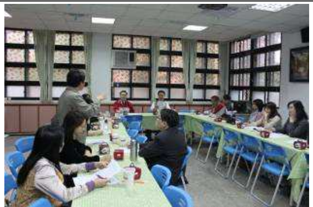
召開 99 年度攜手計畫課後扶助輔導訪視會前會-991203