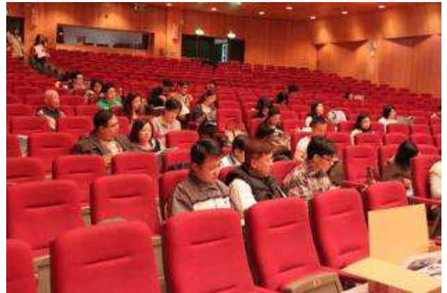
英語歌曲演唱競賽領隊會議-991201