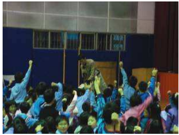
◆ 11/16(二) 三年級租稅教育宣導。地點：活動中心。學生有獎徵答情形。