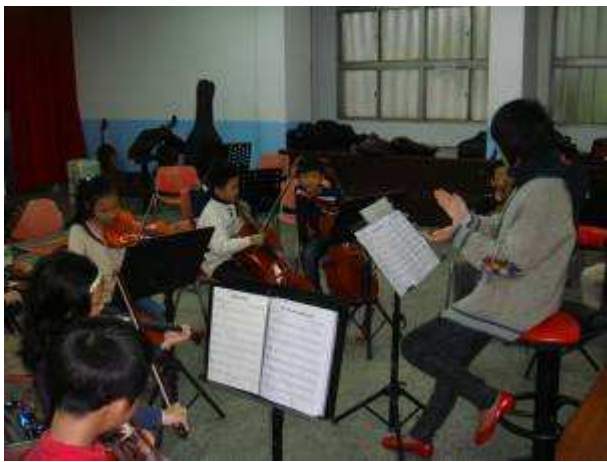
◆11/24 弦樂 B 團晨練，注意拍子節奏。