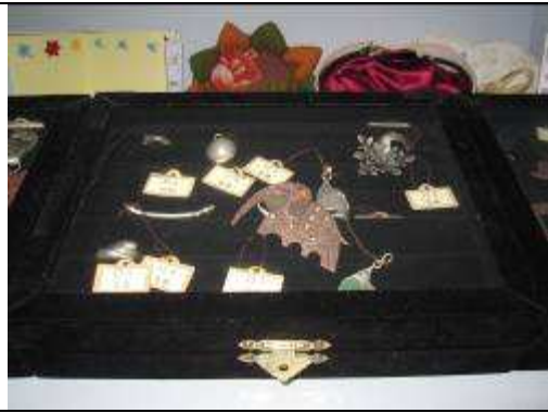
新莊裕民國小國際文教中心志工到校與本校文教中心暨志工經驗交流