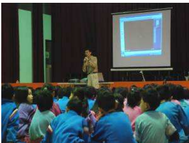
◆11/16(二)三年級租稅教育宣導。地點：活動中心。學生專注情形。