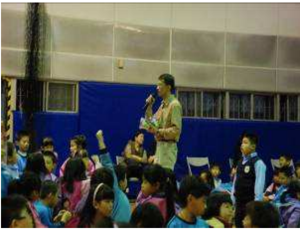
◆ 11/16(二) 三年級租稅教育宣導。地點：活動中心。學生有獎徵答情形。