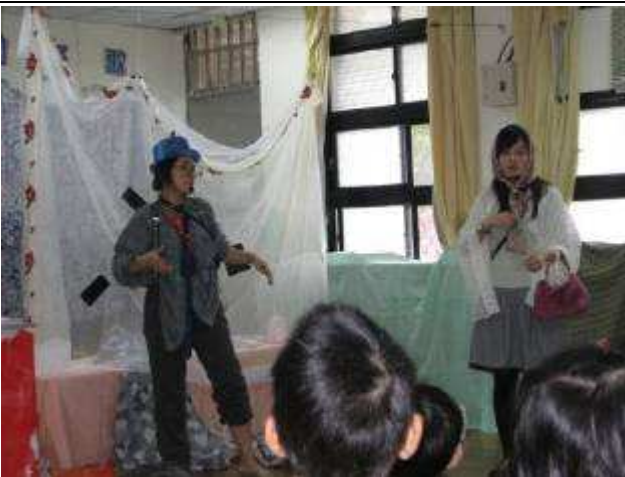
11月兒童劇場—慌張先生