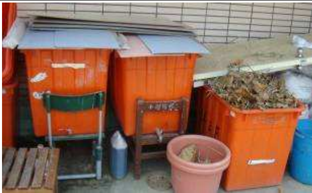
綠屋頂之教學農場（落葉堆肥、果實累累、綠意盎然）