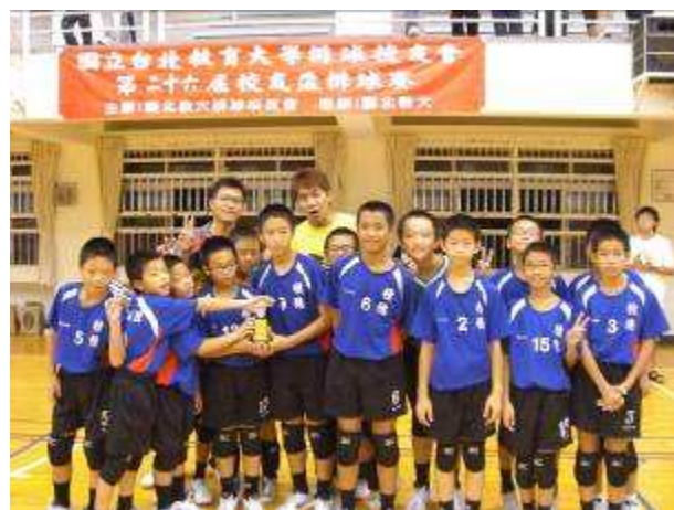
◆12/4-7 校友盃排球比賽，六年級男生獲得季軍，翁教練與球員合影。