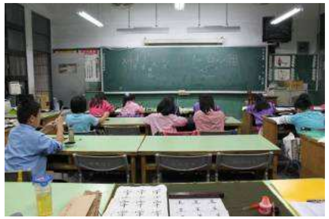
書法班 A 班（四、五、六年級）上課-991105