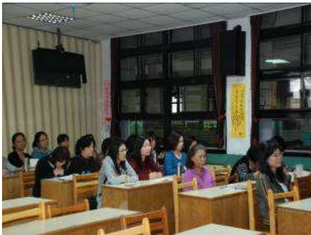
◆ 11/5 (五) 友善校園議題：正向管教研習。地點：第二會議室。教師專心聽講一隅情形。