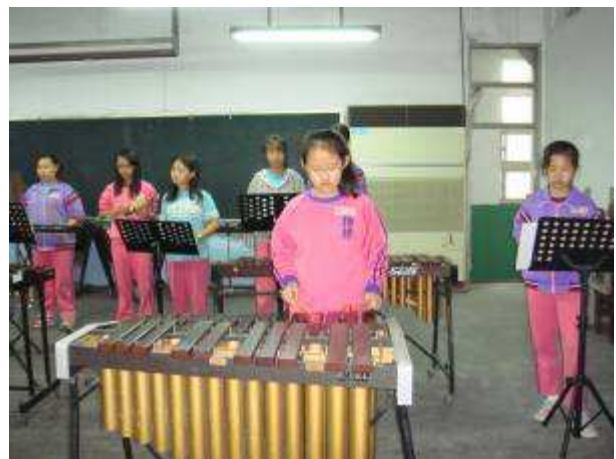
◆ 11/22 六年級打擊樂團晨練一隅。