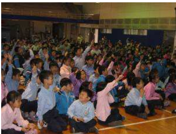
◆ 11/5(五)三年級口腔保健宣導。地點：活動中心。學生有獎徵答好熱烈情形。