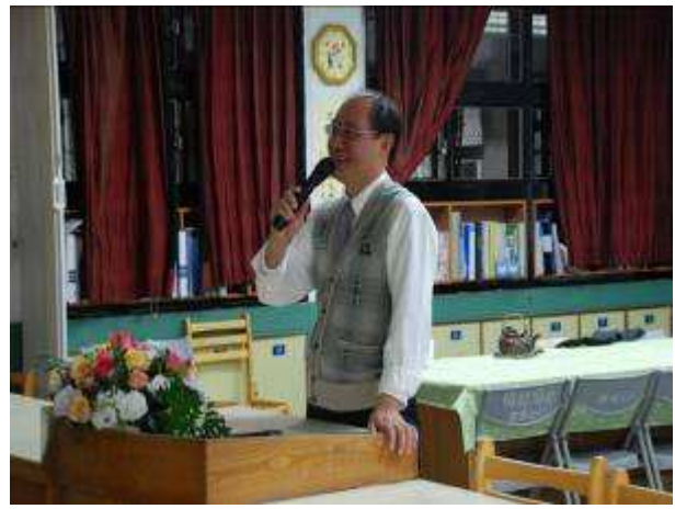
◆ 11/5(五)友善校園議題：正向管教研習。地點：第二會議室。池主任演講。