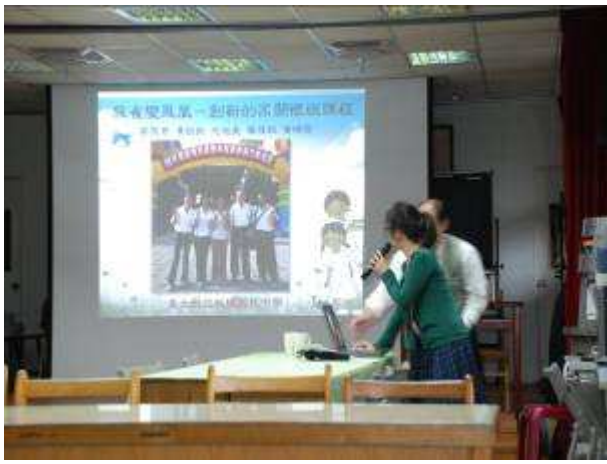
◆ 11/5 (五) 友善校園議題：正向管教研習。地點：第二會議室。