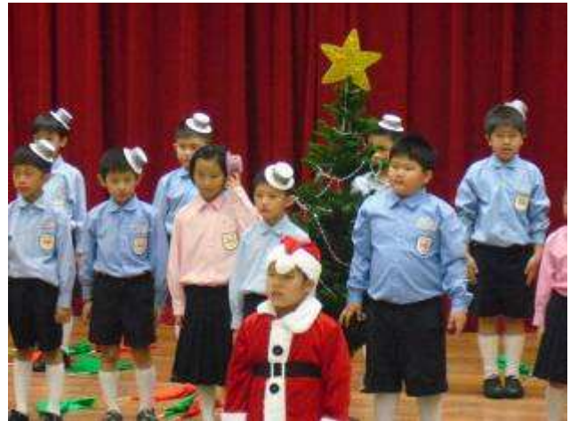
二年3班參加低年級組英語歌曲演唱競賽-991116