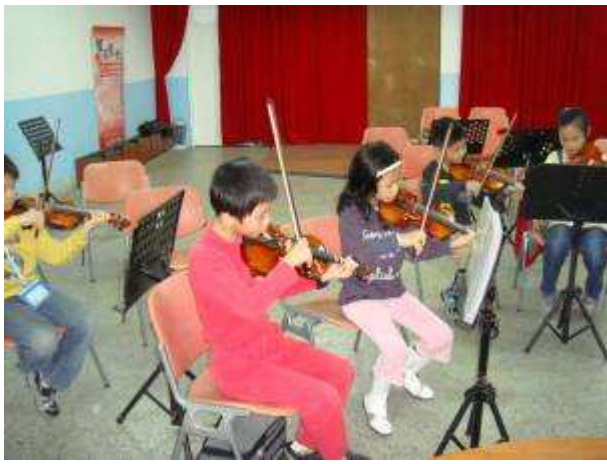
◆11/24 弦樂 B 團晨練，認真最重要。