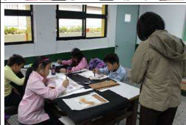
二、三年級書法班 (B 班) 上課-991126