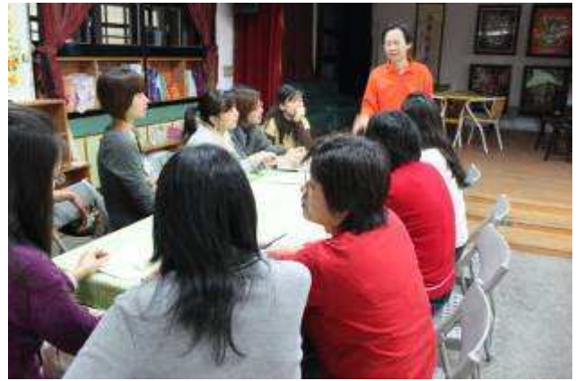
召集攜手扶助課後班教師開會-991124