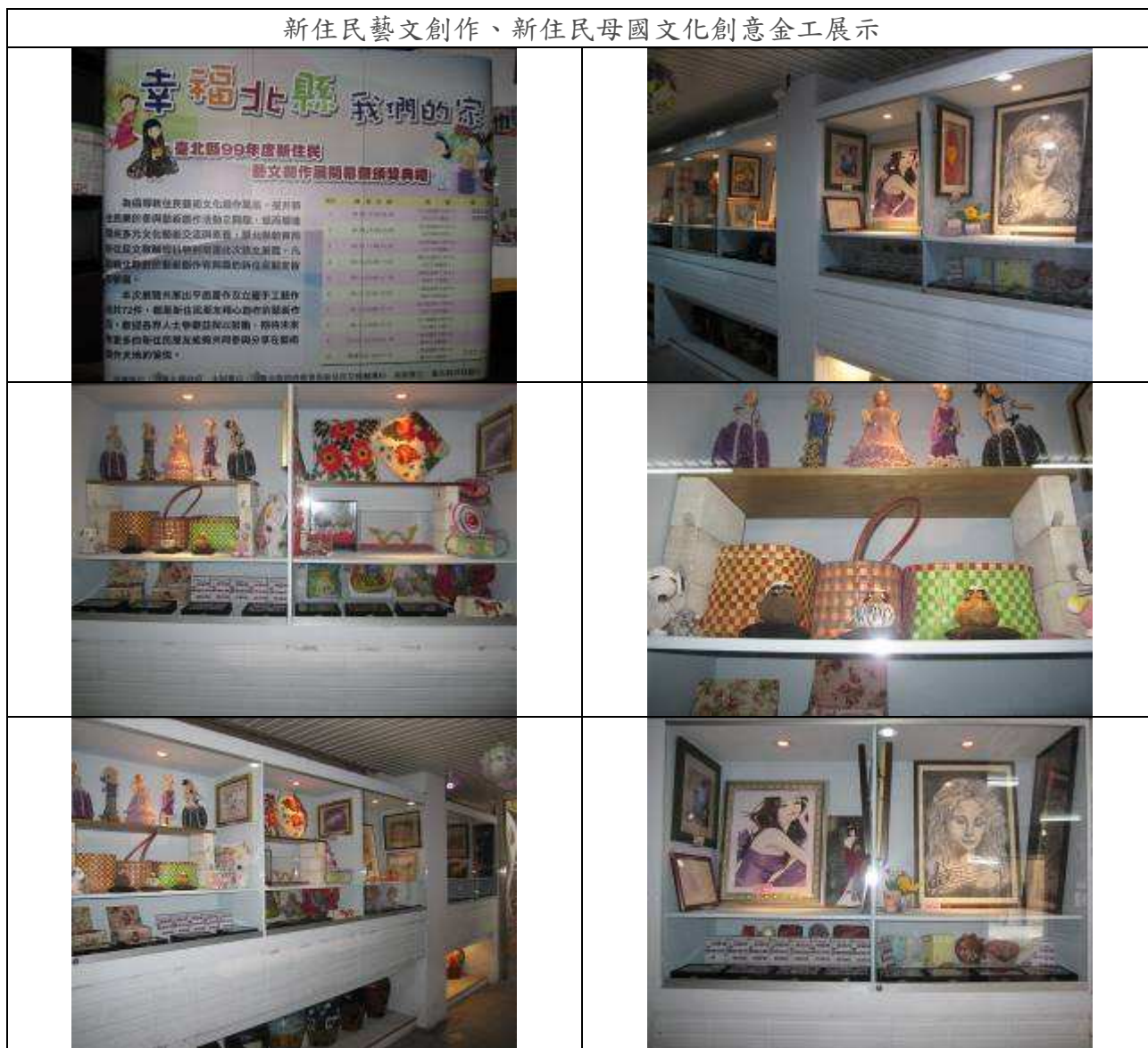
新住民藝文創作、新住民母國文化創意金工展示