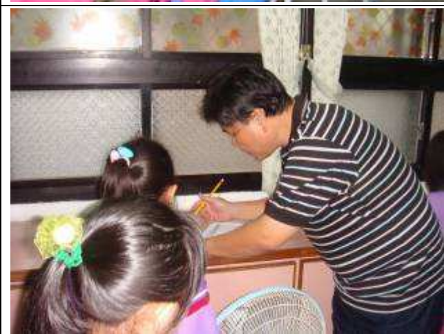
進行校內語文競賽抽籤（演說、朗讀）-991122