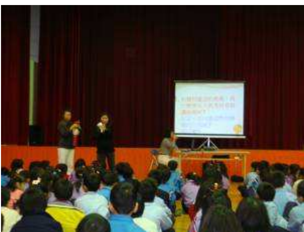
◆ 11/23 (二) 三年級感恩教育宣導：大愛媽媽話劇表演。地點：活動中心。