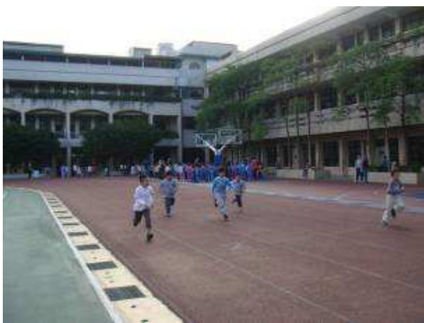
◆一年級 60 公尺預賽，盡力、快樂最重要。