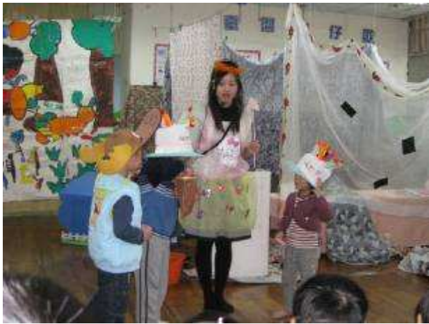
糖果仙子祝福小壽星