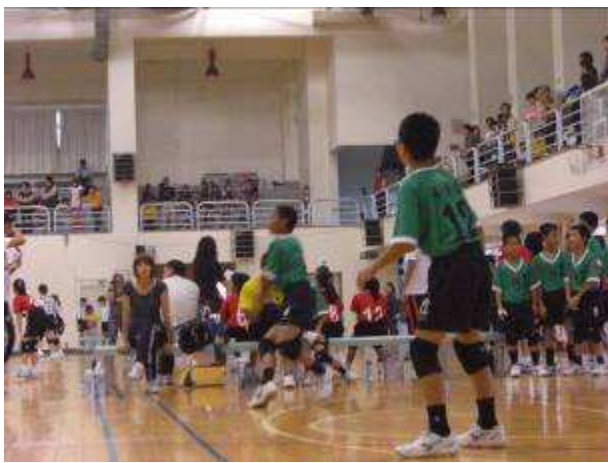
◆12/4-7 校友盃排球比賽，六年級男生比賽情形，地點：國北教育大學。