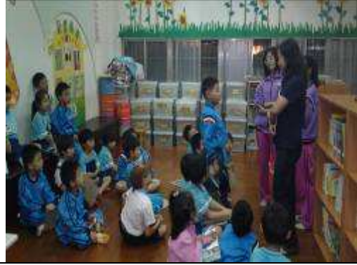
三四年級弱勢家庭子女於群英繪館，進行繪本導讀活動