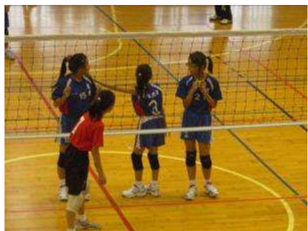
◆ 12/4-7 校友盃排球比賽，五年級女生比賽情形，地點：國北教育大學。