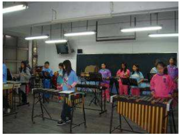
◆ 11/22 六年級打擊樂團晨練，你敲我打大家快樂在一起。