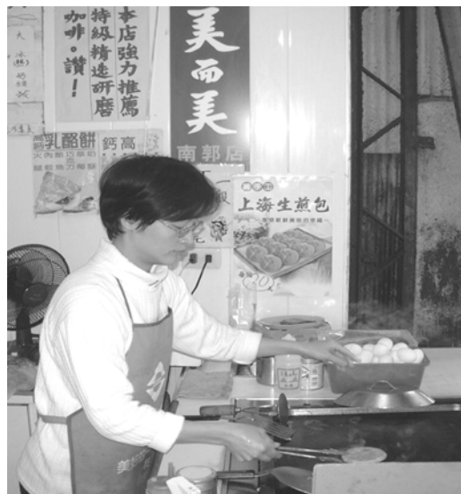
圖 1-1.3 銷售人員