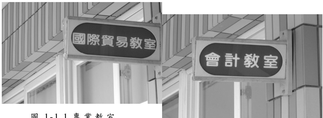
圖 1-1.1 專業教室

商業與管理職群是現代社會中與生活最相關的職群，舉凡士、農、工、商生產之產品或勞務，均需在市場販賣或提供，而商業與管理職群正提供一個給買賣雙方來達成最後交易的平台。