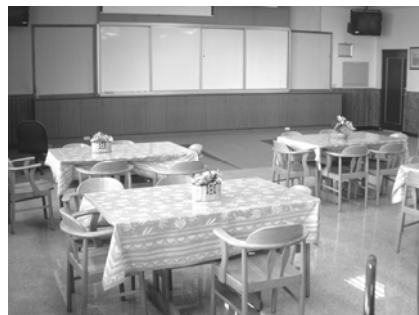
圖 1-1.2 商業經營教室