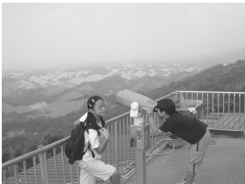
圖 1-1.5 遠眺未來

到職業試探、生涯規劃的目標，讓具有明顯職業傾向之學生能找到適合自己性向、興趣的類科，以便日後能朝此發展，避免一味的隨波逐流，擠大學之窄門。因此，若對商業與管理職群有興趣者，日後可直升實用技能班或就讀商業學校相關類科，不僅可習得一技之長，並在政府暢通二條國道(高中升大學，高職升四技二專)的策略下，亦可繼續深造進修，對參與試探之學生，真可謂是進可攻、退可守的策略，尤其在大專院校大幅開放之際，不僅可半工半讀方式來完成學業，更是將所學理論的知識、技能，應用到實際工作上，以收「做中學」之最大成效。