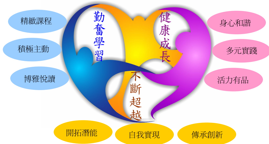
圖一：大新國小學童學習願景圖

「勤奮學習、健康成長、不斷超越」是本校共同的願景。學校願景圖的意義：三人為眾，又橘色為「大」字主軸，「心」者與「新」諧音，是為本校之名。三個互相手牽手的三種顏色的人形圖像圍成一個心的圖樣，代表著尊重與融合個體差異的人群攜手團結一心的力量，也象徵著結合學生、教師，與家長三股力量共同成就大新學童學習的願景。茲圖示如下：