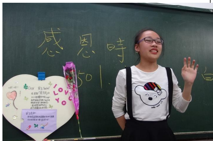
自行創作愛的禮物送給媽媽