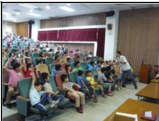
有獎徵答~小朋友都很踴躍