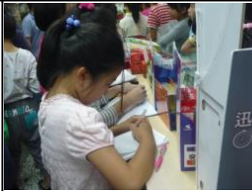
小朋友認真的寫筆記