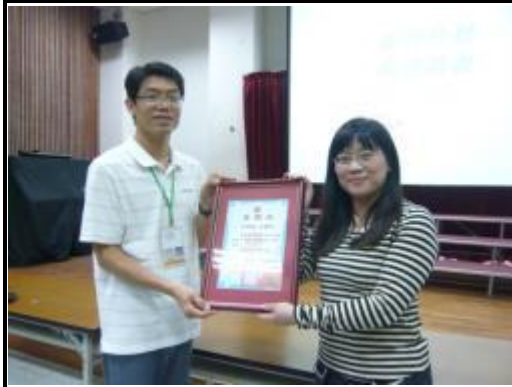
頒給校藥師感謝狀