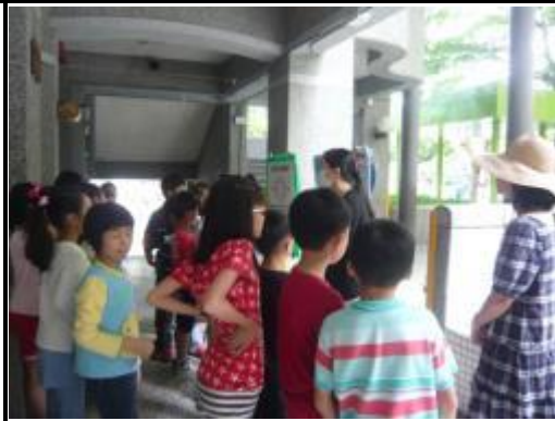
社區藥局參訪行前說明