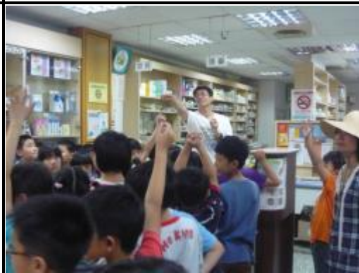
小朋友很踴躍的發問