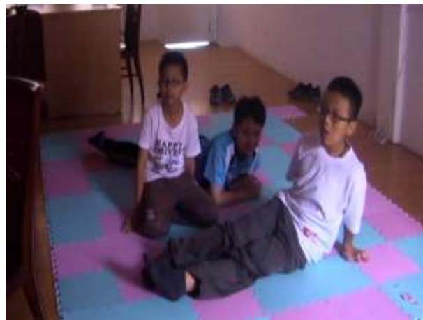
8.觀看情緒緒小影片。