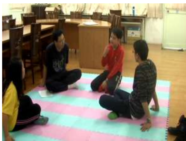
10.以理情治療法來分析並處理成員的情緒。