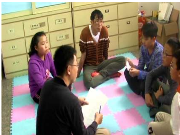
1.團員自我介紹，互相認識。