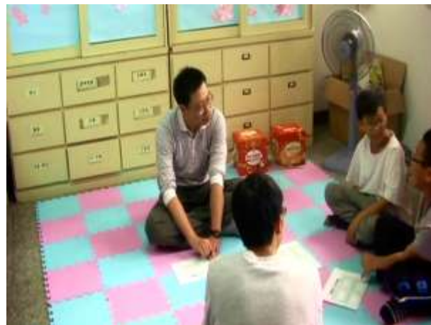
2.認識情緒，藉由學習單認識自己的情緒。