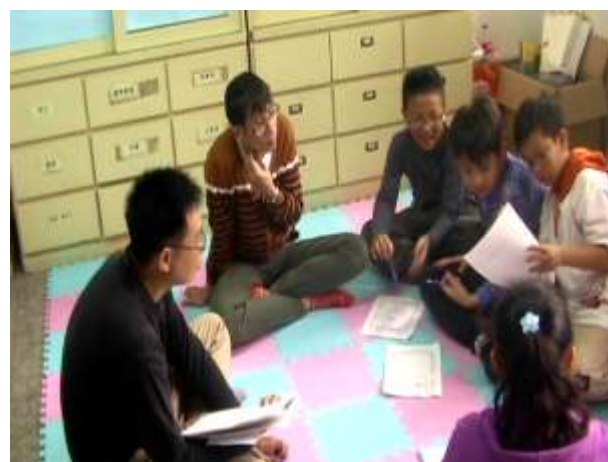
4.Leader 講解 A-B-C 理論，學員輪流討論。