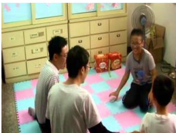
3.藉著情緒卡表演情緒，讓成員加深對於自己與別人情緒的認識。