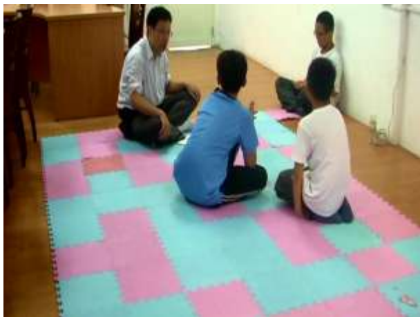
7.再次演練-A-B-C 理論，並加深學員對—A-B-C 理論的熟悉度。