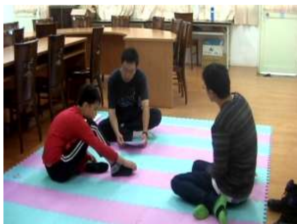
12.對團體歷程回顧，並給予團員一一祝福。