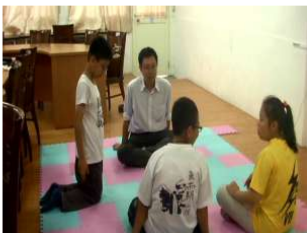
9.處理成員的憤怒議題，並歸納和理處理情緒的方法。