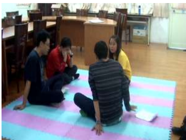
11.演練理情治療法理論，並處理成員自己與別人的情緒。