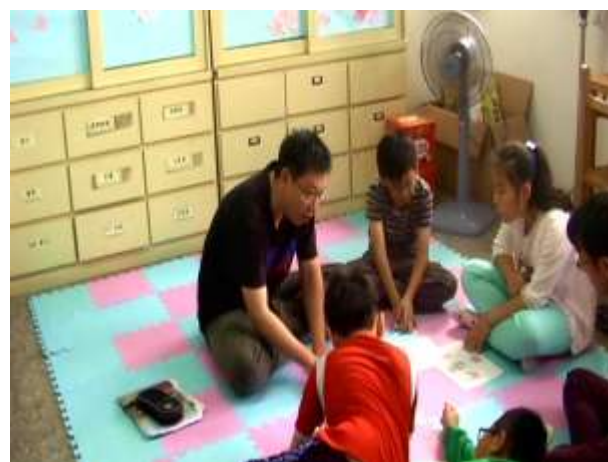
6.複習 A-B-C 理論，並檢視學員的非理性信念與情緒。