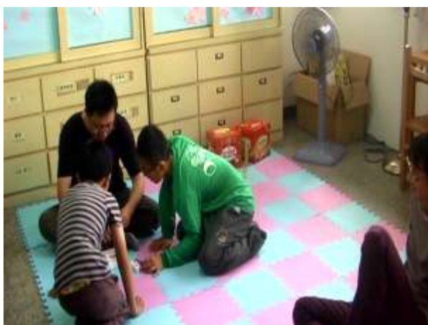
5.閱讀繪本-家有小恐龍，並分組討論。