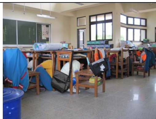
102.9.13 《防震暨生命教育宣導》