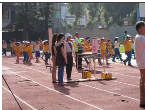
102.9.13 《防震暨生命教育宣導》