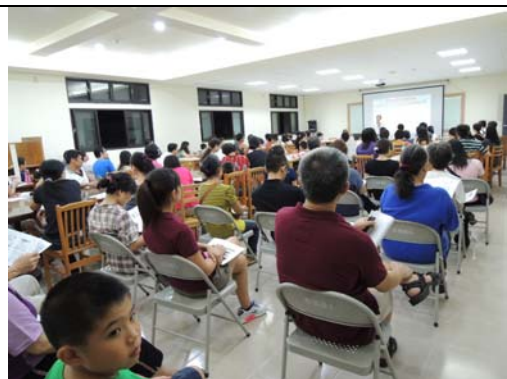
102.9.14 《12 年國教宣導》