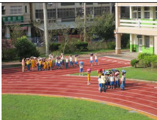
102.9.13 《防震暨生命教育宣導》