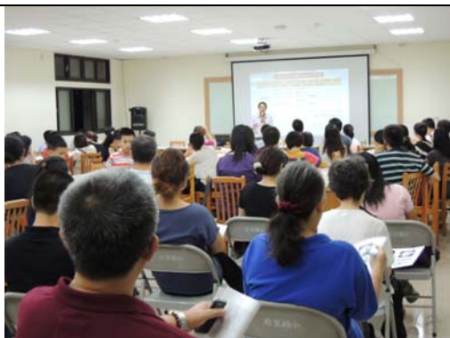
102.9.14 《12 年國教宣導》