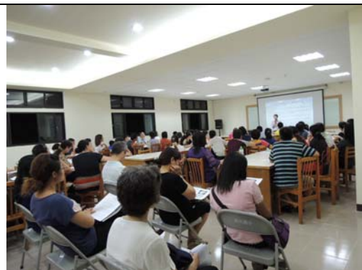
102.9.14 《12 年國教宣導》