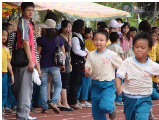
中年級 100 公尺競賽