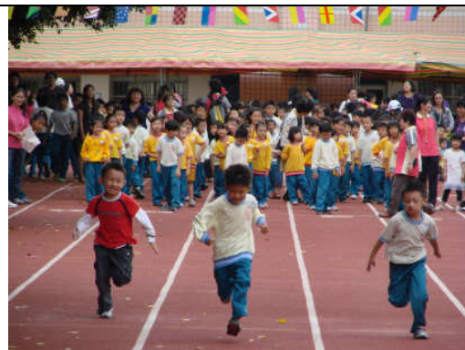
低年級 60 公尺競賽