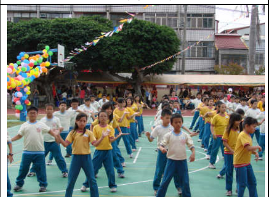
高年級健康操表演