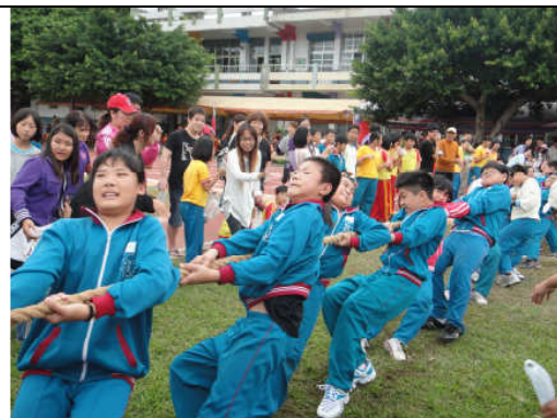
五六年級拔河冠亞軍賽