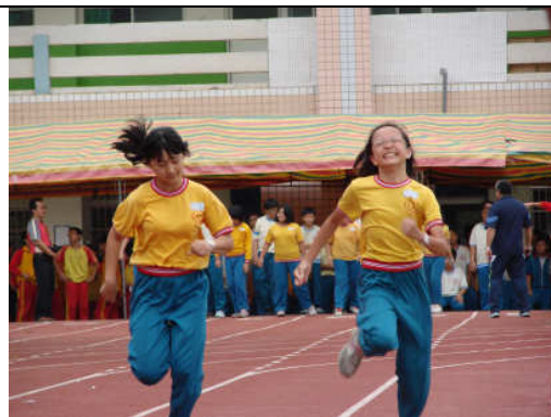
高年級 100 公尺競賽