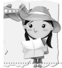
社會領域 立足臺灣我的根 SDGs接世界