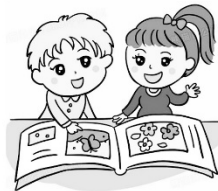
語文領域(閱作) 寒假閱讀趣