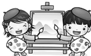
藝術與人文領域(美勞) 我是策展人