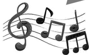
藝術與人文領域(音樂) 屬於我們的天空