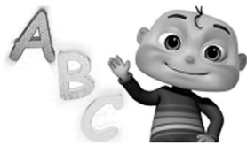
語文領域(英語) Fun with Reading