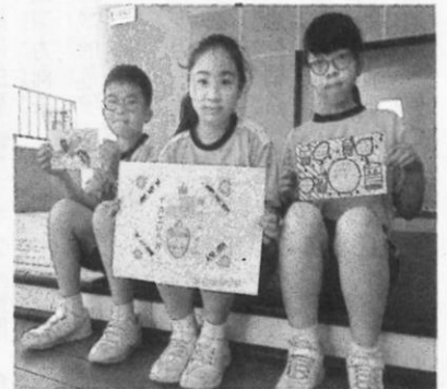
口罩套圖樣，展現學生設計巧思。

案，讚揚臺灣出色的防疫表現。小朋友親自把卡片寄到各防疫單位，也親手送到社區藥局、診所，表達謝意。孩子在專題報告中寫：「臺灣能夠很多天零確診，是各單位合作防疫的成果，國人都遵守防疫規定、照顧好自己才能做到。我發現：臺灣人不只友善，努力照顧自己又樂於助人，才有今天各國的肯定。」這段話為課程做了很棒的結論。