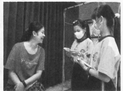
學生採訪教師，了解學校防疫工作。

先備經驗，引導他們查找和選讀合適的網路資訊。學生個人必須查找一則與臺灣防疫相關新聞，記錄觀察與看法；小組則把資料結合防疫單位的採訪，製成專題報告。 為了讓學生了解整個防疫網絡，四年級的六個班級，分頭探究學校、藥局、醫院、里辦公室、內政部移民署和衛福部疾管署的角色和防疫功能，再以班級為單位進行分享。 創作傳達感謝 學生創作口罩套的圖案，以「盾牌」代表臺灣防疫發揮了功能，阻止病毒入侵；畫上「醫護人員」，寄寓對醫療照顧的感謝；「飛機」、「酒精」是想提醒機場檢疫人員要保護自己；「太陽」有雨過天青之意，祈禱風波早日平息。也有孩子用戴上口罩的珍珠奶茶、臺灣黑熊、藍鵲等圖