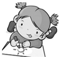
綜合領域：班服設計