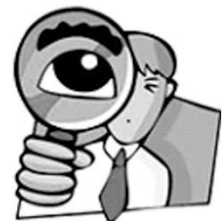
自然領域：科學探究