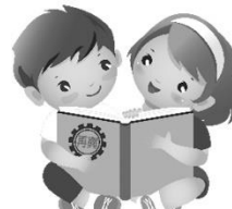
語文領域(閱讀)：閱讀興識界