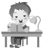
語文領域(國語)： 閱讀智慧王、 小小編劇達人