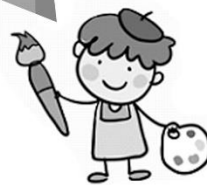
藝術與人文領域(美勞)： 一起看展覽 一起來畫畫