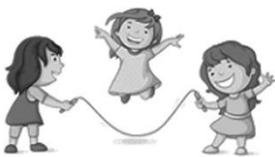
健康與體育領域(體育)： 跳繩樂趣多