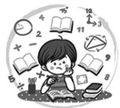
數學領域：數學計算高手