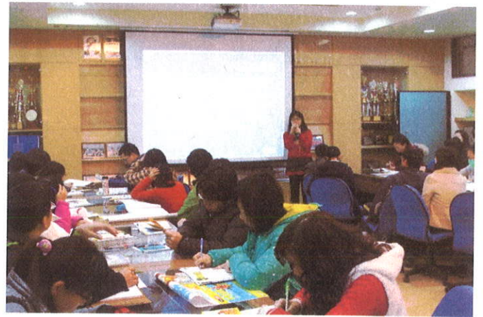
召開交通安全會議-請老師們協助學生上下學安全動線