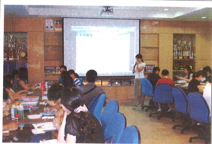
召開交通安全會議-進行工作報告