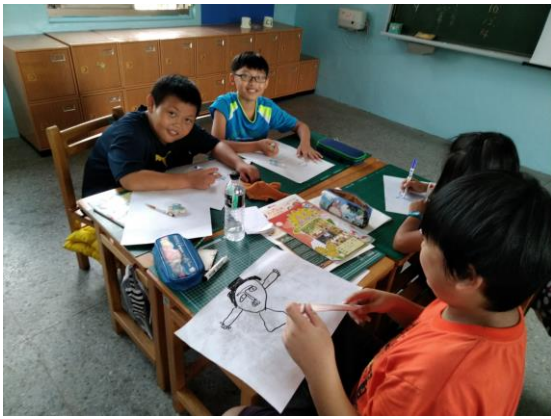
動手繪製、仿畫洪通作品特色。