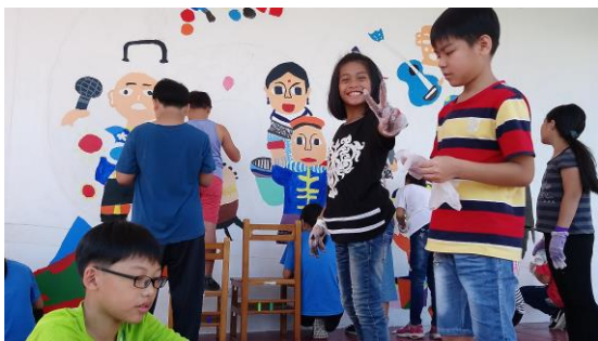
接近完工前的喜悅。