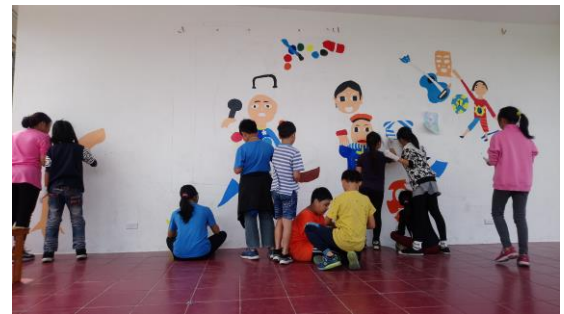
在白色斑駁的牆上，做好每個作品的位置分配與構圖。