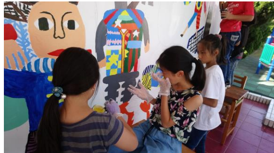
完成一個段落後，開始細部修整。