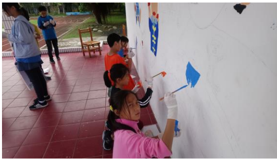
開始各自任務與上色。