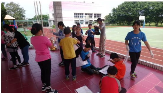
分派任務、開始調色，準備上畫。