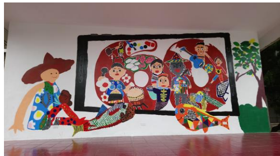
農博·洪通與我 相遇在東明國小