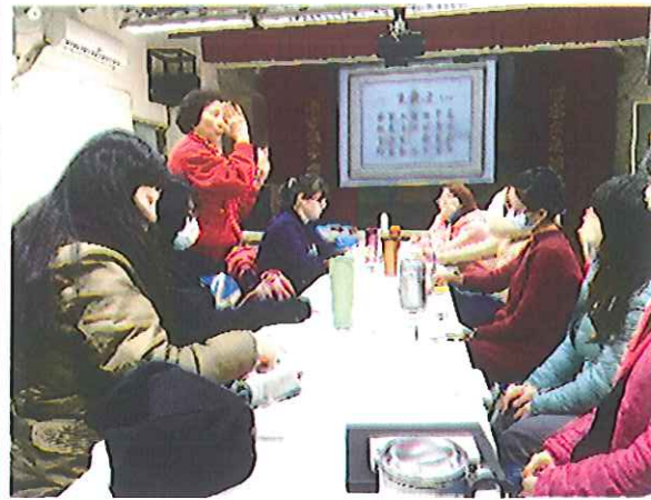
文言文賞析與教學