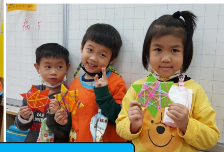
星星繞線做聖誕節裝飾