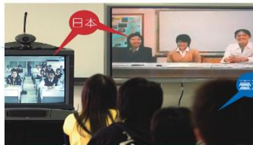
3 透過網際網路，臺灣的學生可以藉由視訊的方式與國外的學校進行遠距教學。