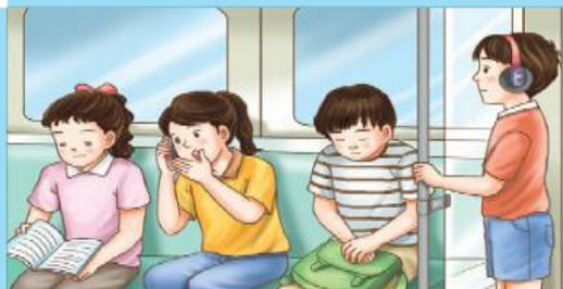
1 在大眾運輸工具上使用手機通話，應簡短並輕聲細語。