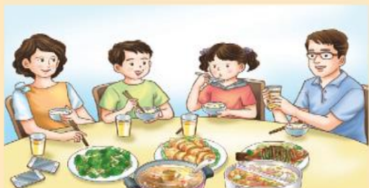
1 不要沉迷手機的遊戲或網路上的訊息，以免影響人際關係的互動。