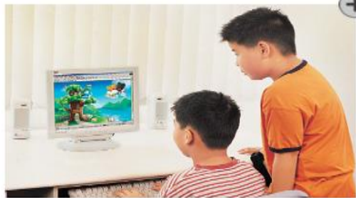
1 利用電腦及網際網路學習、查詢資料。