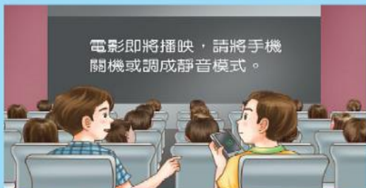
2 看電影前應將手機關機或調成靜音，避免干擾他人。