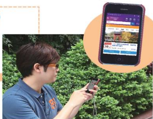
4 隨著科技進步，現在也可以直接用手機上網、傳輸訊息。