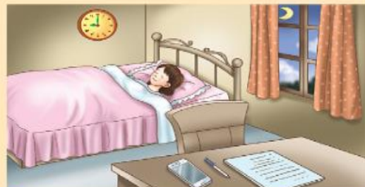
2 不讓手機影響日常生活的規律，該睡覺時就應該準時上床。